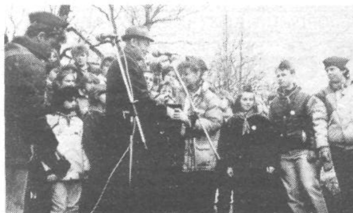
Kurirčkovo pošto so pionirji iz vseh petih ljubljanskih občin pospremili veselo in razigrano ob prijetnih zvokih ansambla 12. nasprotje. Ob tej priložnosti jim je društvo prijateljev mladine občine Lj. Šiška pripravilo bogat in pester kulturni program.

akcije UMAG 88, v Litostroju pa potekajo še zadnji razgovori za izvedbo male hidroelektrarne Bača.