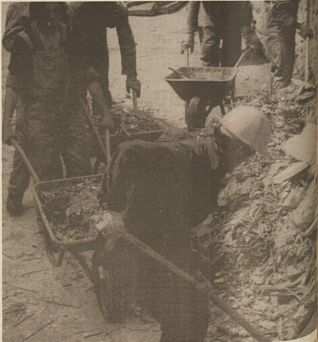
Med drugim bo potrebno odpeljati še na tone ruševin, da bo šola v Voljčah spet taka, kot jo potrebujejo mladi prebivalci te vasice v Posočju