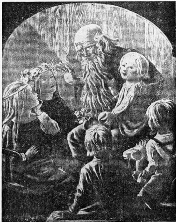
Otroci so zvesto poslušali...

duše. Ta voda pa more pogasiti ogenj vic, oziroma more ohladiti žgoče bolečine ubogih trpečih duš.«