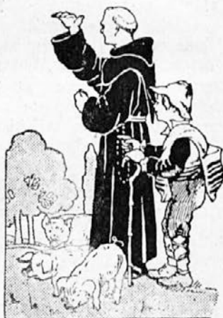
Deček se je ponudil patru za kažipota.

Od ene časti se je dvignil do druge, postal je škof, kardinal in leta 1585. celo papež. Nadel si je ime Ksikst V. in je vladal sveto Cerkev pet let. Ustanovil je nadbratovščino pasu sv. Frančiška, ki jo imenujemo pri nas zvezo Frančiškovih križarjev in sestic sv. Klare. — Ponižnost, postrežljivost in vljudnost so dvignile siromašnega pastirčka na papeški prestol.