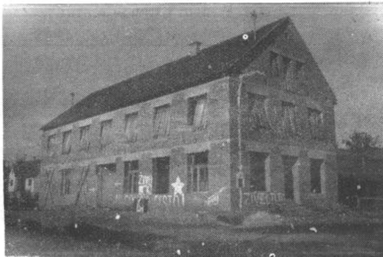
Morda bi kazalo v tem nedograjenem združenem domu urediti vsaj stanovanja?