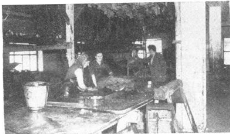
Tudi ženske se uveljavljajo v proizvodnji. Na sliki: Delavki v tovarni usnja