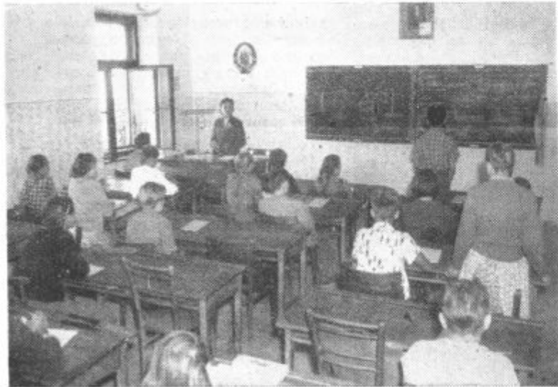
Tudi učenci so učili in izpraševali

79,2 %. Če upoštevamo, da ima od 500 slabo ocenjenih učencev kar 209 le eno slabo oceno, smemo upati, da bo uspeh ob koncu šolskega leta precej porasel. Ob letošnjih uspehih vsekakor ne smemo iti mimo požrtvovalnega dela naših učiteljskih zborov, ki so storili mnogo več, kot zahteva gola uradna dolžnost. Od 2682 učencev, kolikor jih obiskuje naše šole, jih je kar 1289 dobivalo dodatno pomoč izven učnih ur, kar je vsekakor v precejšnji meri vplivalo na doseženi uspeh. Precej učencev se je izživljalo tudi v raznih interesnih krožkih, ki jih v glavnem povsod vodi učiteljstvo. Posebno razveseljivo pa je dejstvo, da so novo izvoljeni šolski odbori krepko posegli v delo na izobraževalno vzgojnem področju. Posebej je omembe vredno to, da narašča interes staršev za šolo. To dokazujejo številni in dobro obiskani roditeljski sestanki pa tudi šolski obiski, saj znaša v povprečju kar 96 %. Zamude gredo predvsem na račun raznih obolenj, ki terjajo čimprejšnje sistematične zdravstvene preglede šolskih otrok.