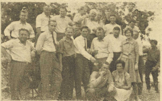
Po napornem delu se je treba spočiti. Del članov kolektiva Kovinskih obratov v Mariboru na izletu