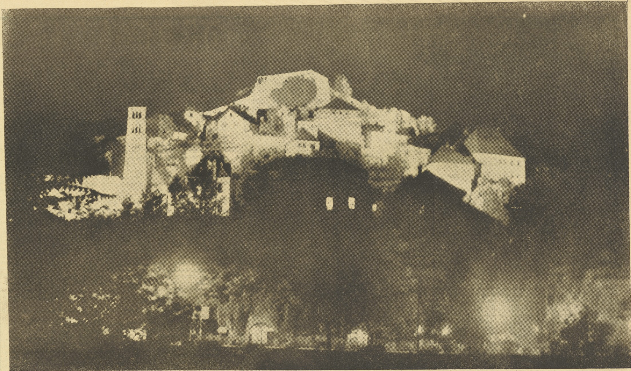
JA JCE OB DVA JSETI OBLETNICI LJUDSKE REVOLUCIJE