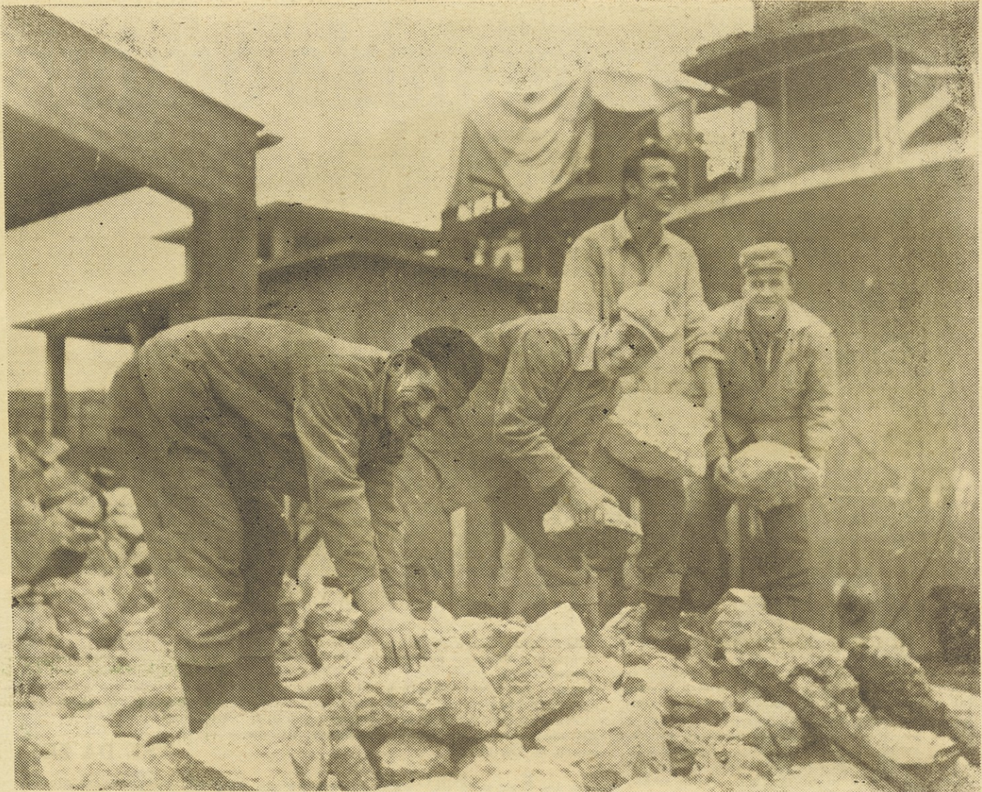
Delo v gradbeništvu je zelo pestro in včasih je treba zagrabit tudi za tako delo. Na sliki skupina delavcev iz gradbišča tovarne Celuloze v Medvodah