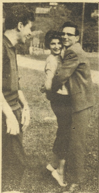
Ljuba ženka, oprosti, da sem dvignil brez Tvojega odobrenja moj »ustvarjeni višek« v ekonomski enoti.