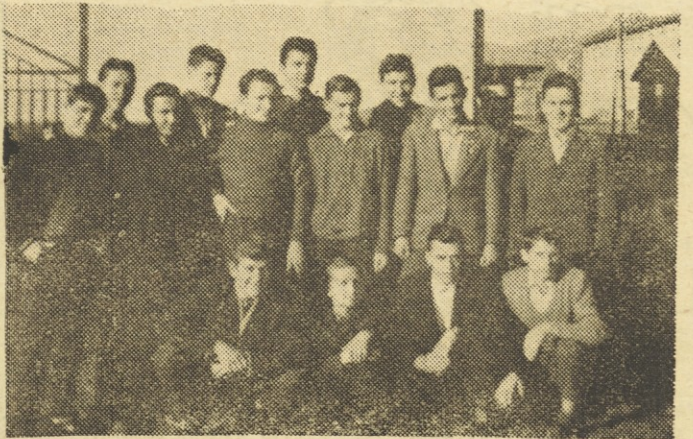
Skupina mariborskih vajencev