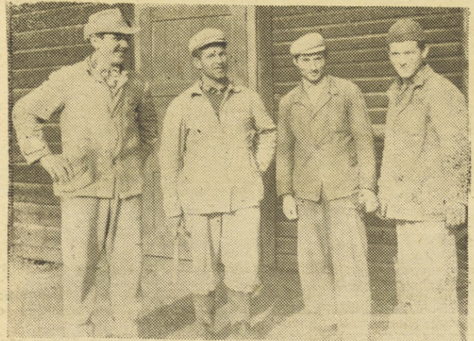
Na gradbišču INDOP — v Podutiku gradimo prvo in največjo tunelsko peč. Graditelji, večina mladi delavci so na svojo delo zadovoljni kar dokazujejo tudi nasmejani obrazi