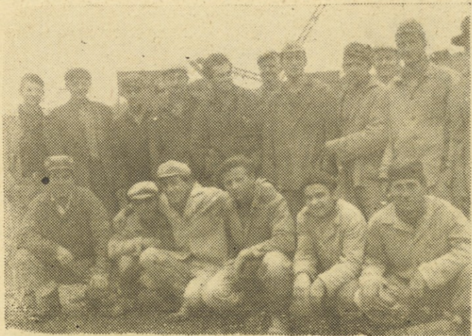
Na stavbišču »Vodmat« v Ljubljani v času pol urne pavze