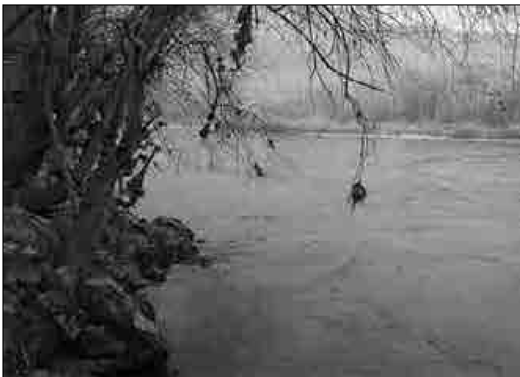
Fotografija prikazuje območje prehoda med Spodnjimi Ribčami in Drčarjem (foto: Jože Rozman, 22. december 2005).