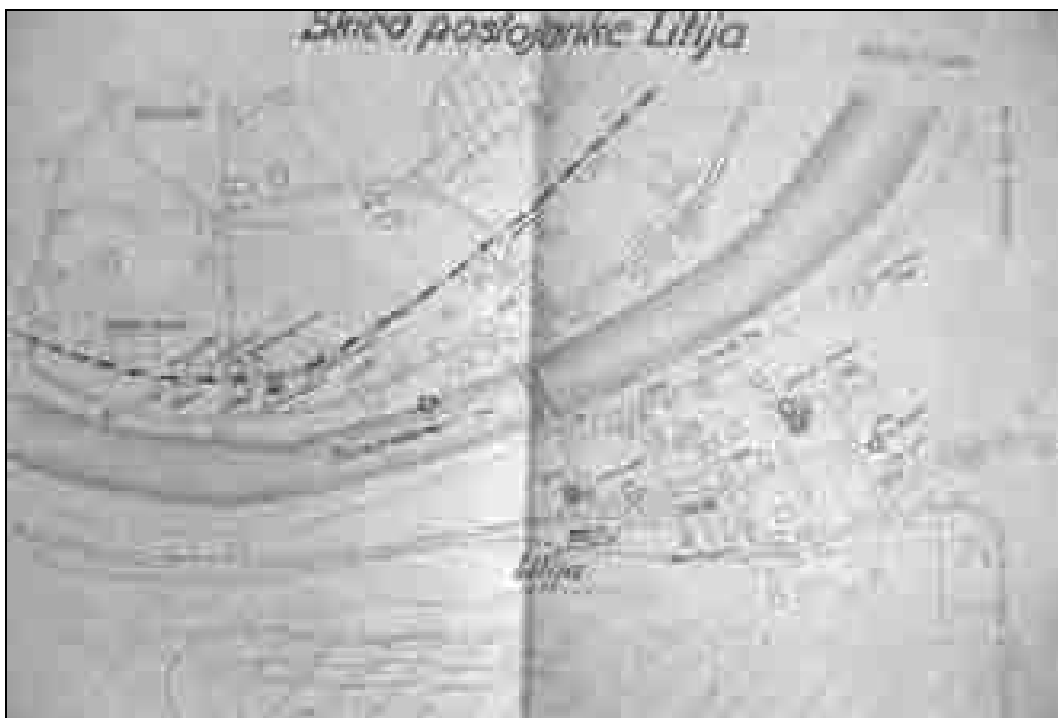
Skica postojanke Litija (ARS, AS 1851, 62/II).

Podobno je bila z bunkerji utrjena tudi postojanka v Veliki Preski, kjer so bili večinoma graničarji, v letu 1944 pa prav tako domobranci in vermani. Številčno stanje postojanke je bilo podobno kot v Prežganju.