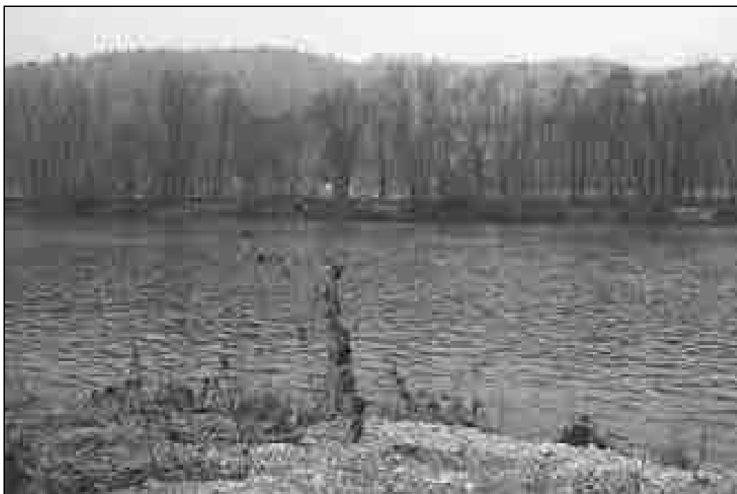
Slika prikazuje območje prehoda med Hotičem in Presenčevim mlinom. V ozadju je vidna ravnina med reko in gozdom, kjer so bili transporti podnevi še posebej izpostavljeni (foto: Jože Rozman, 22. december 2005).