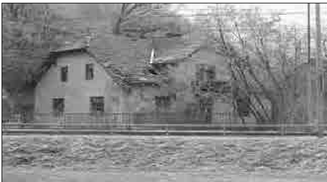
Postojanka v Jevnici. Slika prikazuje hišo ob železniški progi v Jevnici, ki so jo Nemci prezidali v utrdbo (foto: Jože Rozman, 22. december 2005).

Med Kresnicami in Litijo je bila postojanka v Pogoniku oz. Zgornjem Logu (Logu) 18 (na drugi strani reke), ki je imela nalogo varovati železniški most 19 čez Savo. Posadka, v povprečju 80 mož, je bila nastanjena v gradu, v Logu pa je bila protiletalska baterija (okoli 20–30 vojakov) s tremi protiletalskimi topovi. Na vsaki strani mostu, ki je bil ponoči osvetljen, je bilo stražarsko mesto; most in predora so varovale utrdbe. V dveh izmed njih so bili postavljeni zgoraj omenjeni protiletalski topovi.