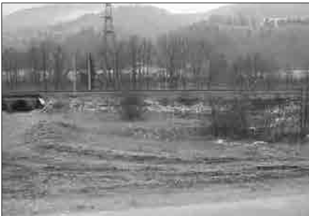
Slika prikazuje dostop do levega brega Save na območju prehoda Mačkovina. Številni prepusti in podvozi so partizanom olajšali prečkanje dobro nadzirane železniške proge (22. december 2005).