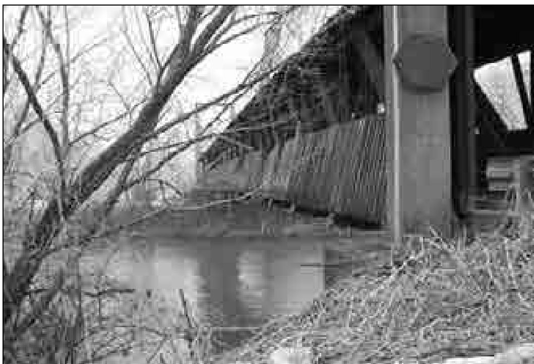
Slika prikazuje viseči most med Senožeti in Jevnico. Na tem mestu je deloval brod vse do 8. septembra 1959, ko ga je nadomestil most (foto: Jože Rozman, 22. december 2005).