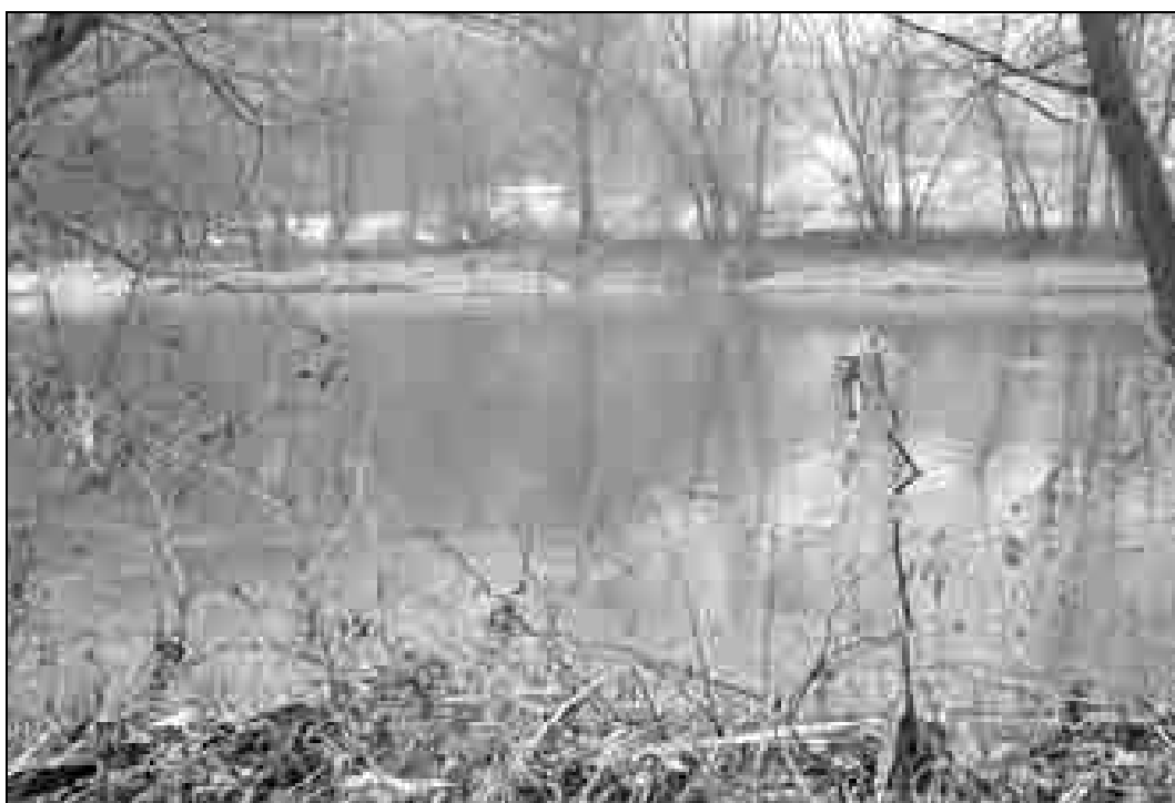
Slika prikazuje območje prehoda med Zgornjimi Ribčami in Slatnarjem. V ozadju je ob cesti in železniški progi vidna domačija Slatnar pod Kresniškim vrhom.