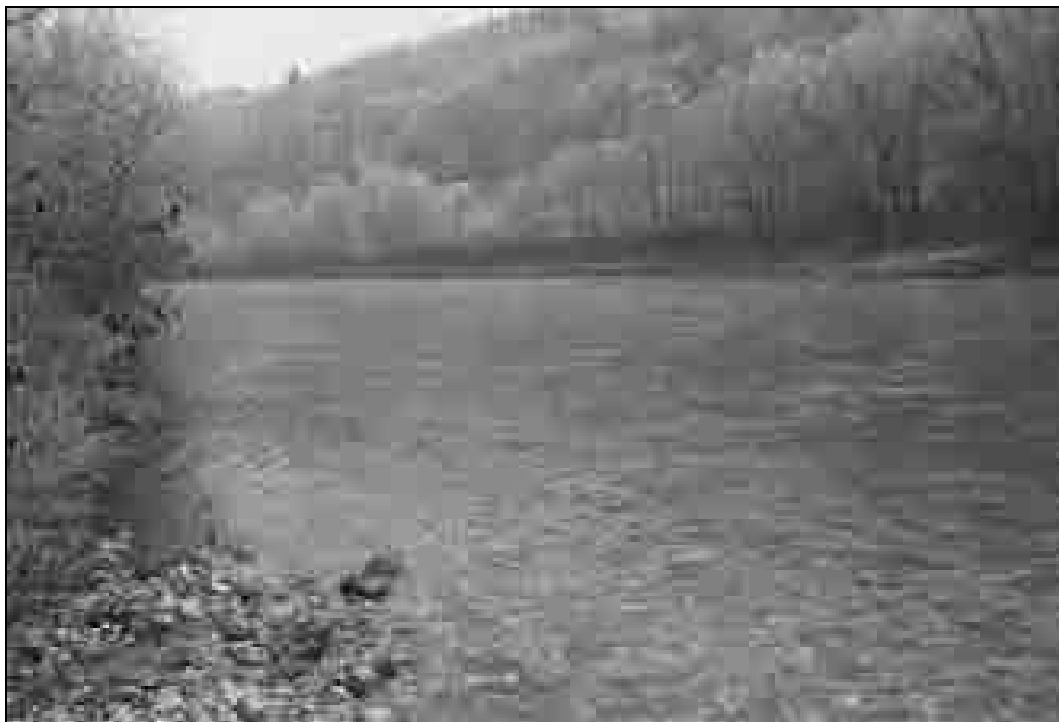
Slika prikazuje reko Savo v območju prehoda pri Lipi. Slikano z levega brega (foto: Jože Rozman, 22. december 2005).