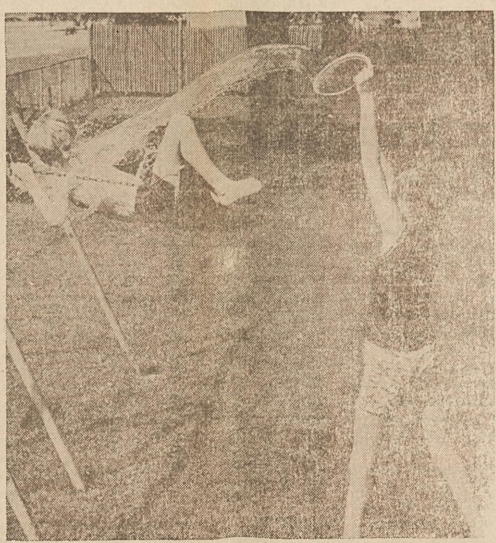
POMLADNO VESELJE IN NORČIJE — Toplo sonce zvabi otroke na zelene trate k igri in vsem vrstam norčij. Tole je bilo posneto v Fort Wayne, Ind. Fotografija je dobila Kodakovo nagrado.