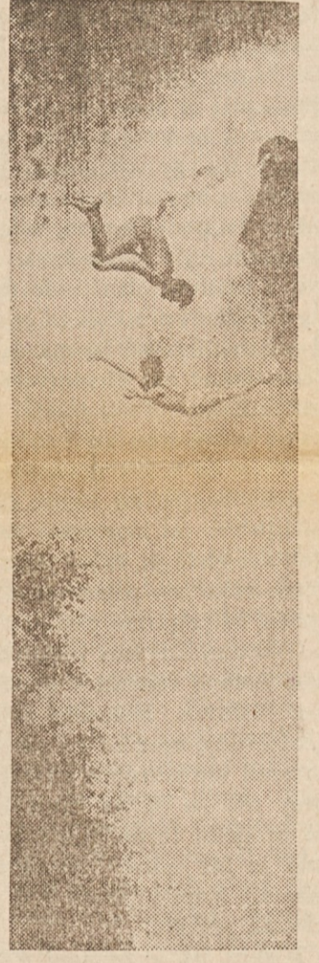
NEVARNA REJČA? — Ne tako, kot izgleda. Prijateljica sta skočila v mirno vodo pod slapom, ko ju je njun tovariš ujel na film, Posnetek je bil nagrajen na Kodakovi mednarodni razstavi.