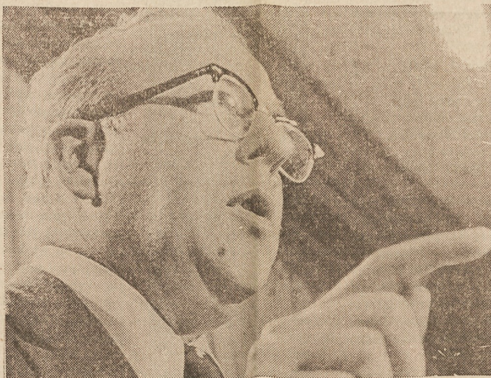
George P. Shultz

ZENEVA, Šv. — Leta 1955 so na vsem svetu nalovili okoli 30 milijonov ton rib, lani pa okoli 70 milijonov ton. Pri sedanjem ulovu pride na vsakega prebivalca na svetu povprečno 20 kg rib na leto, kar je sorazmerno veliko.