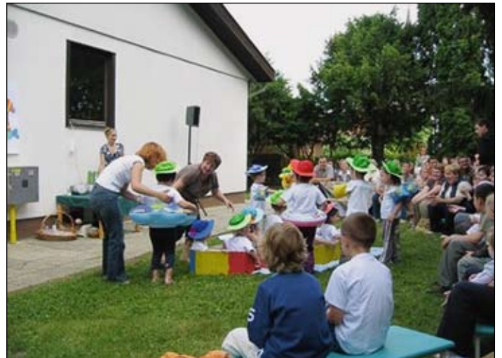
Utrinki z zaključne prireditve vrtca