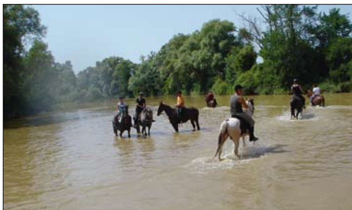
Utrinek z jahanja po naši občini

Konjeniki in vozniki vozov smo se zbrali na praznični dan ob 9. uri pri cerkvi in spomeniku na Grabah. Po okrepčilu in pozdravu udeležencev smo se dogovorili o poteku jahalne poti in o načinu jahanja. To je bilo nujno potrebno, saj se je jahanja udeležilo 16 jahačev in dva voznika vozov, konji in jahači pa so bili različnega znanja in sposobnosti. Veliko pozornosti smo posvetili varnosti jahačev in konjev. Vodja jahanja je bil kdo drug kot naš najbolj izkušeni jahač - Božo Borko.