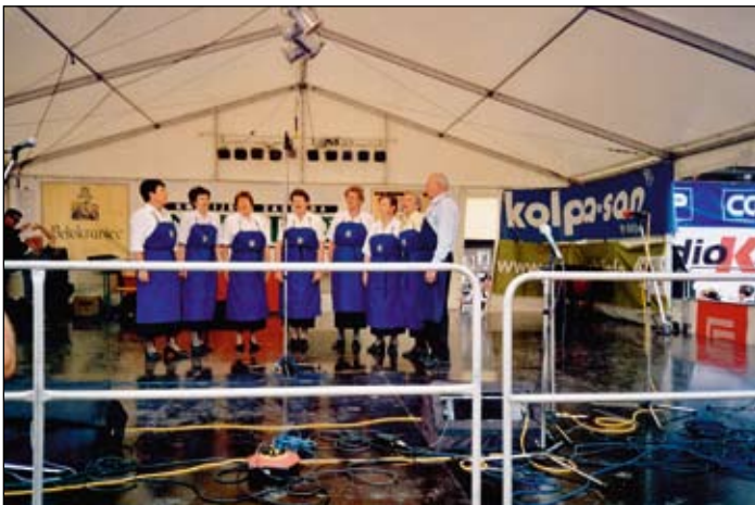
Obreški pevci ljudskih pesmi v Metliki

Nisem še omenila pujse Pepe. Veste, ves čas je bila tiha in mirna, varno spravljena v prtljažniku avtobusa. Bila je pečena in na koncu čisto shirana. Ste že ugotovili, za kakšno pujso gre?