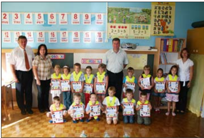
Prvi šolski dan

Po vznemirljivem začetku šolskega leta so se prvošolčki okrepčali s slastno tortico in napitkom.