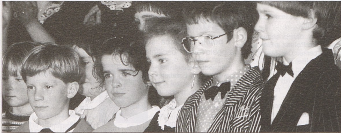
V Selah otroci doslej niso imeli možnosti obiskovati otroškega vrta. Ali se bo dala ta želja uresničiti?

„To je podoba položaja na Koroškem v letu demokracije 1958, trinajst let po tem, ko pravijo, da je bil teror nacizma dokončno zrušen“ je zapisal NAŠ TEDNIK 20. marca 1958.