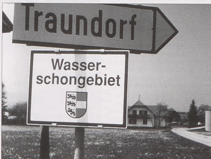
Der Klärschlamm dürfte nach dem derzeitigen Gesetz unsinnigerweise sogar im Wasserschongebiet als Dünger aufgebracht werden.

Wie würde im normalen Wirtschaftsleben ein Unternehmer reagieren, wenn ein Vertreter bei ihm erscheint, um diesen mit allerlei Argumenten zu einer riesigen Investition zu bewegen, die Antwort auf die Frage nach dem konkreten Nutzen der Anschaffung jedoch schuldig bleibt?