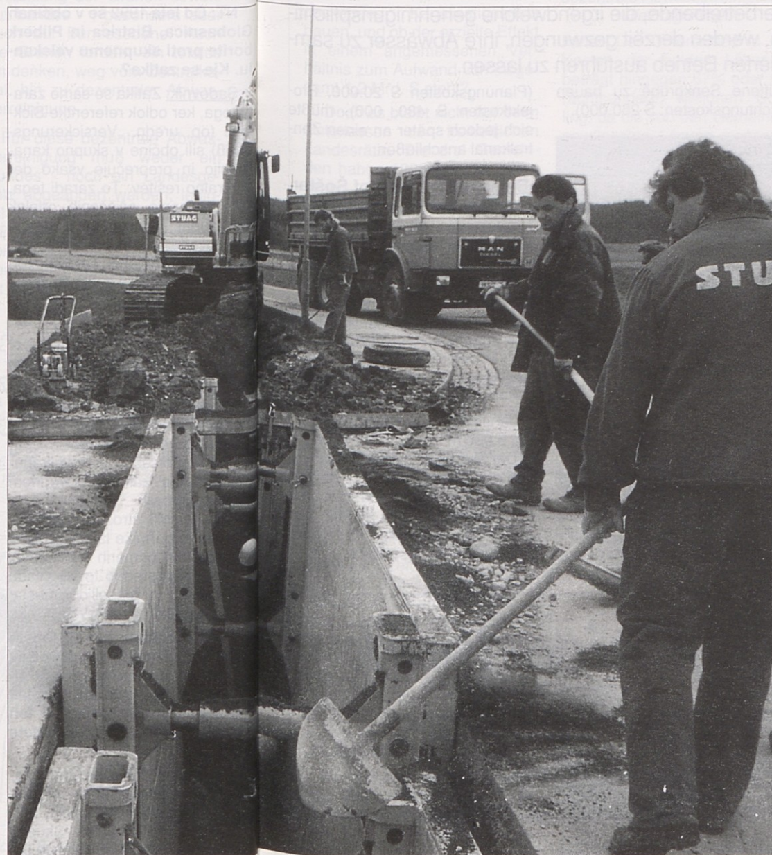
Gradnja kanalizacije je sicer intenzivna, ne prinese pa večjega števila novih delovnih mest.