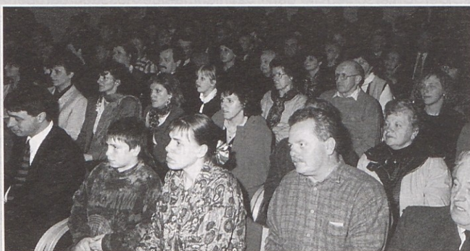
V dvorani v kulturnem domu SPD „Srce“ se je trlo poslušalcev.

Koliko medtem pomeni vokalni kvartet „A capella“ v Dobri vasi, se je dobro pokazalo na njegovi sobotni prireditvi ob 5-letnici obstoja. V dvorani v kulturnem domu se je namreč