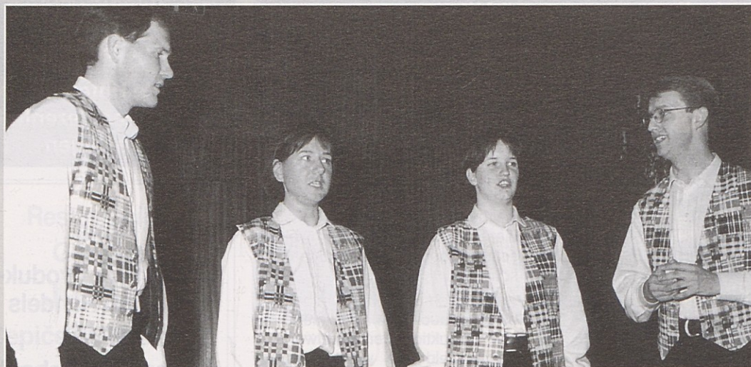
Kvartet „A Capella“ – na jubilejni prireditvi z novimi „lajbäci“.