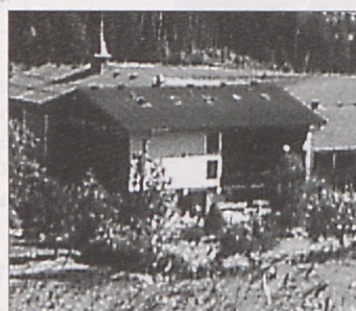
Hotel Petzenkönig bi moral zapreti, ker so stroški previsoki.

schliffene Senkgrube zu bauen (Errichtungskosten: S 250.000).