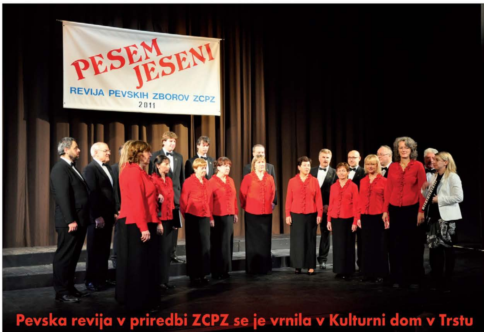
Pevska revija v priredbi ZCPZ se je vrnila v Kulturni dom v Trstu