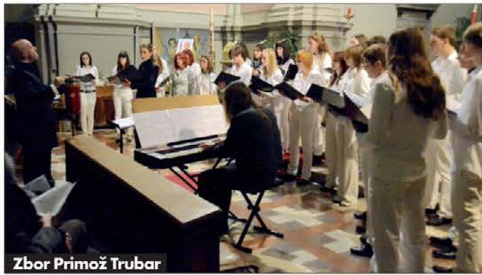
Zbor Primož Trubar