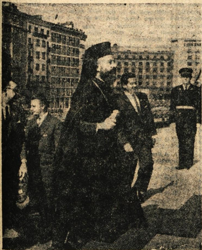
Predsednik ciprske republike Makarios je govoril na včerajšnjem zasedanju. Na sliki ga vidimo pred vhodom v Skupščino

Kolonializem v svojih najrazličnejših oblikah je namreč eden izmed največjih vzrokov nemirov v svetu ter nasoglasji, v katerih svet zdaj živi.