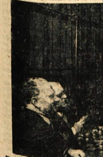
Med velemojstri Svetozar Gligorič je imel srečo pri zrebanju. Prav gotovo pa je čitja več, da bo tudi ob koncu prvi