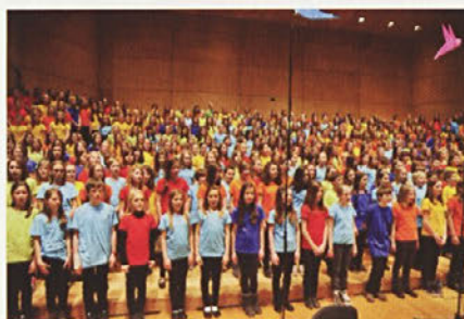
Združeni mladinski pevski zbor Slovenije, med katerimi so tudi pevci iz Gorišnice

»S Potujočo muziko želimo spodbujati veselje do petja med mladimi in se pokloniti dragoceni tradiciji zborovskega petja pri nas, hkrati pa je to izvrstna priložnost za slovenske skladatelje, da napišejo nove zborovske skladbe. Seveda nismo edini, ki praznujemo dan zborovskega petja - vsako leto ga z