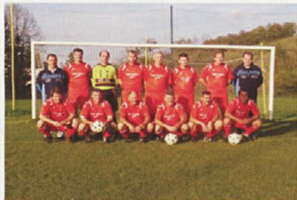
veterani NK Gorišnica