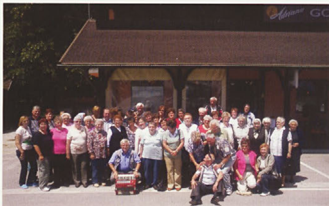
Izlet na Gorenjskem

V društvu upokojencev Zagojiči je nekaj pevskih skupin, dva harmonikarja in še drugi glasbeniki, ki popestrijo razne prireditve. Najbolj aktivni pa so športniki, ki igrajo pikado in viseče kegljanje. Poleti se srečujejo tedensko v vaškem domu in na »gmajni«, kjer so naprave za viseče kegljanje in balinanje. Pozimi pa si krajšajo puste dneve v fitness centru Feguš, kjer so dobili svoj prostor za sestanke in športne aktivnosti. Za vse to je