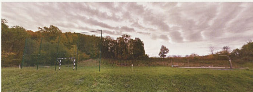
Vaška parcela z igriščem

V vaški skupnosti smo v letu 2011 očistili južno brežino igrišča na vaški parceli ter nasadili smreke, da bi preprečili zdrs zemlje na igrišče. Opravili smo tudi izravnavo terena igrišča, posejali travo in uredili drenažo terena. Na severni strani igrišča smo postavili stebre za zaščitno ograjo. Asfaltirali smo cesto Strmec - Tibolci (Pritnska), uredili bankine od mosta čez reko Pesnico do Zamušarov, ter izvedli manjše gramoziranje ceste do hišne številke 19, družine Golob. Uredili smo tudi dokumentacijo in darilne pogodbe za cesto ter izvršili odmero cestne trase. Delno smo renovirali znamenito Žnidaričevo kapelo (zamenjali stavbno pohištvo, preuredili notranjost, pobarvali fasado). Med drugim se pripravili tudi PGD projekti za vaški dom.