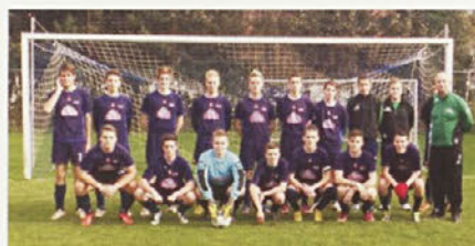
mladinska ekipa NK Gorišnica