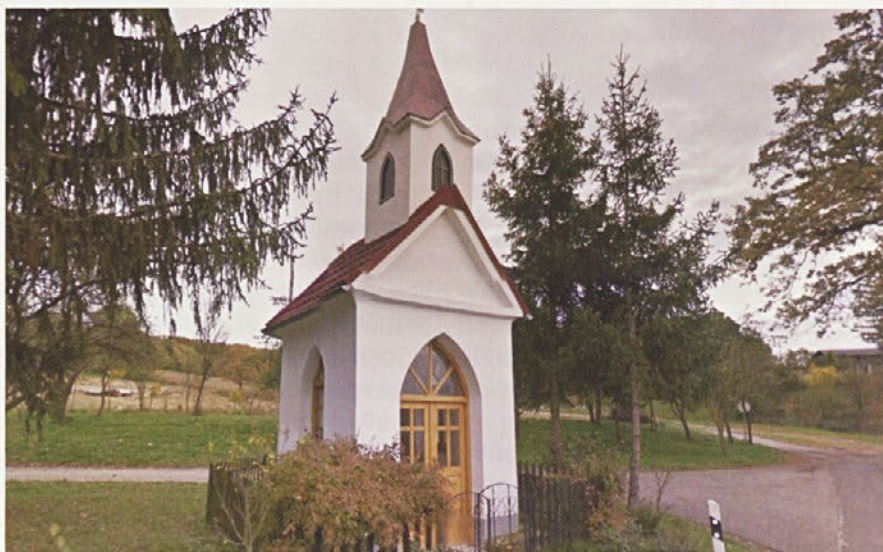
Renovirana Žnidaričeva kapela