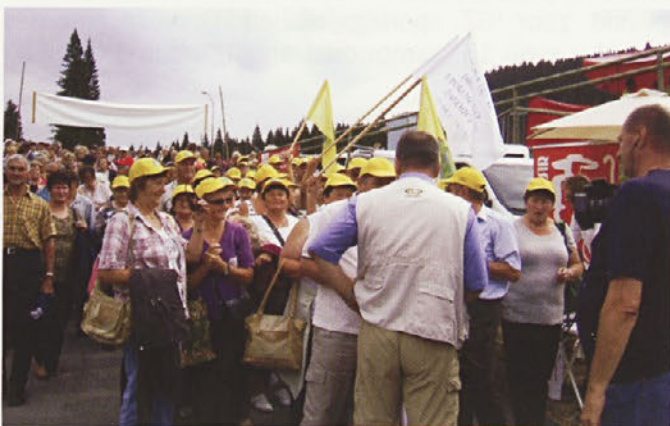
Srečanje na Pokljuki