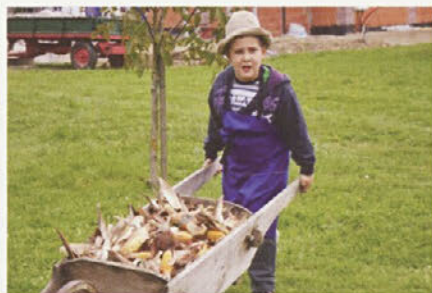
Spoznavalí smo delo in življenje nekoč na Dominkovi domačiji.

na koncu so Hrvati premagali Gruzijce za 1 točko. Po tekmi smo se polni navdušenja odpeljali domov.