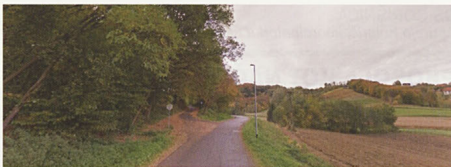
Novo zgrajena razsvetljava in cesta

Na koncu naj še omenimo občino Gorišnica, brez katere bi naša dela in cilji bili težko izvedljivi, zato se občini zahvaljujemo in upamo, da bo sodelovanje še naprej potekalo dobro in korektno.