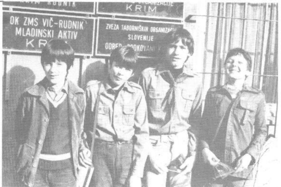
Na fotografiji so člani »domače« ekipe vod »Pobesnelih marsovčkov«