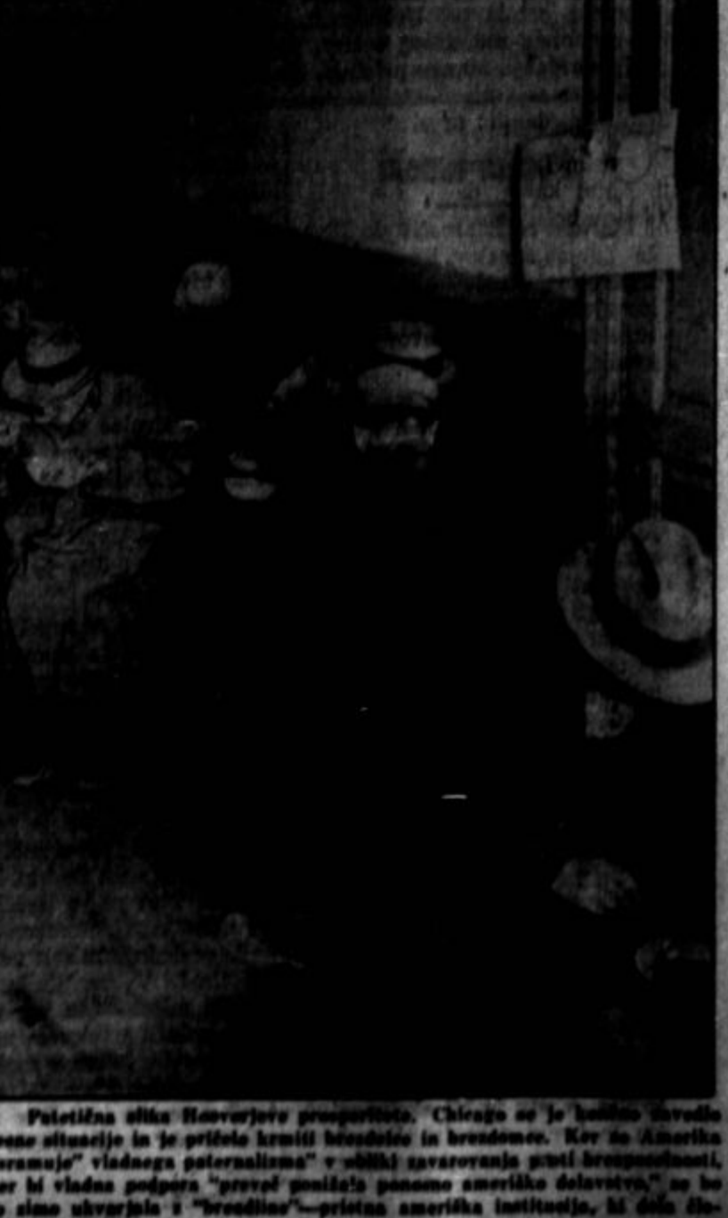
Patetična slika Newyorvskega prosvetl. Chicago se je lanihno zvedela rene situacije in je priložilo kritični besedilo in besedence. Ker za Ameriko "svetlo" vladnega paternalizma v obliki zavarovanja proti brezposelnosti, ker bi vladna podpora "prevelj ponudila pamomno ameriške delavstvo", se bo te sliče zavrnila in "breadline" — pristoja ameriška institucija, ki delu slovske samopomoči...