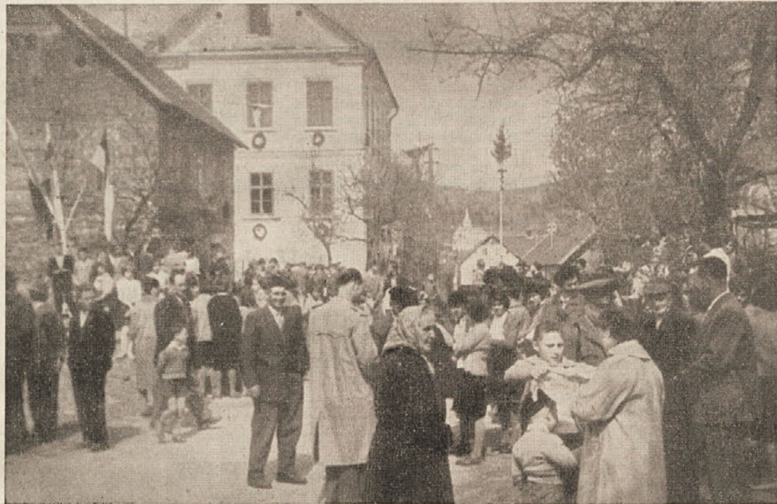
Praznično razpoloženi ljudje v Vasi, na dan praznovanja