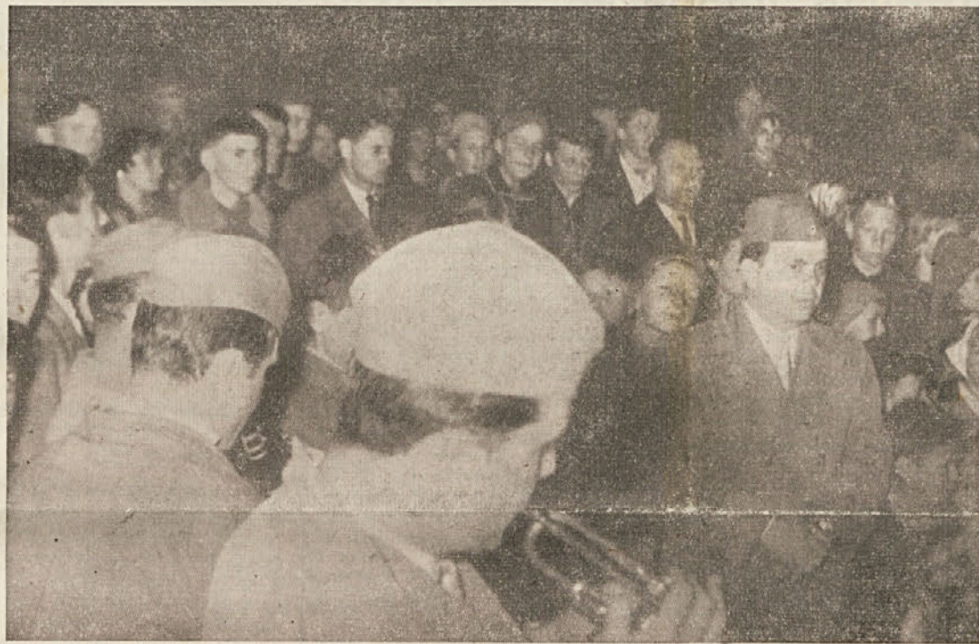
Godba DPD Svobode je za praznovanje 1. maja veselo zaigrala

17. maja ob 9. uri dopoldne bo v sejni dvorani Občinskega ljudskega odbora v Kočevju sektorsko posvetovanje o problemih pionirskih starešinskih svetov in pionirske organizacije za področje občin Kočevje in Ribnica. Na posvetovanje je vabljenih nad 40 delegatov in gostov, med njimi so predsedniki in sekretarji starešinskih svetov, člani občinskih zvez in zastopniki Zavoda za prosvetno pedagoško službo.