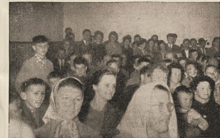
Mitingi v času NOB, sedaj pa kulturne prireditve so v dolini Kolpe vedno dobro obiskovane

Nešteto je bilo potem še bojov, predno smo prišli do svobode. Tu v naši dolini se je v letih boja razvijala naša prva ljudska oblast, naši NOO. Ves čas boja je delala na našem območju močna organizacija OF. V letu 1944, še v času boja, smo izvajali prve svobodne volitve v naše osvobodilne odbore. Od januarja 1944 do kapitulacije Nemčije je bila naša dolina splošno kulturno in politično središče Kočevske. Tu so se zadrževali predstavniki okraja in komande mesta Kočevje, tu so bile centralne tehnike, bolnice