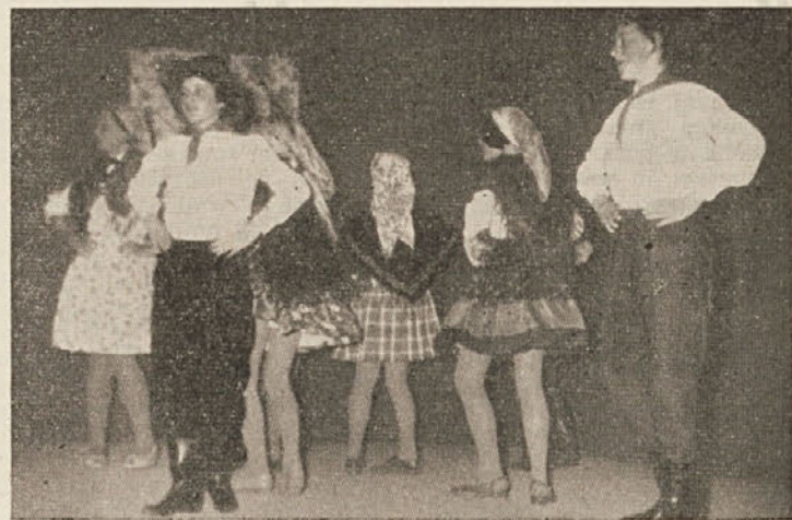
Mladost in veselje v dolini Kolpe na praznovanju

in vojaške ustanove, šole itd. Mitingi, predavanja in manifestacije za našo svobodo, vse to je naše ljudstvo vedno podprlo; v tem so sodelovali otroci, žene in dekleta, kakor tudi vsi starejši ljudje. Možje in fantje so se borili v brigadah. Naša svečanost, ki sovпада s