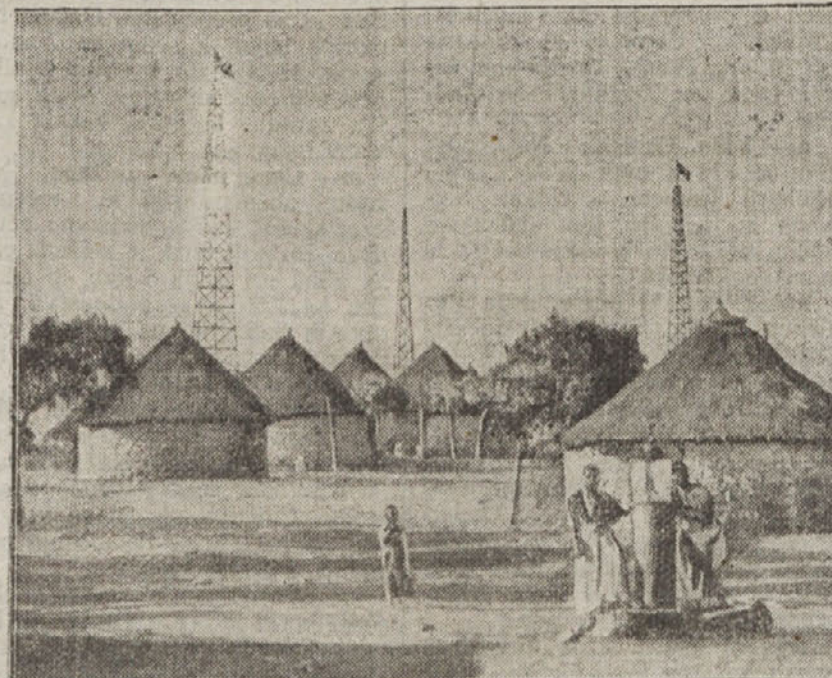
Italijanska radio postaja v abesinski vasi pri Asmaru.

ja, ki je šla skoz našo državo, je vodila iz Padove do državne meje v Planini pri Rakeku ter od tam v Ljubljano. Tu je bila kontrolna postaja. Vozači so prispeli nekako ob devetih, razen zadnje vozačice Francozinje, ki je privozila nekoliko pozneje. Zato so se ji odbile nekatere točke. Če bi prispela pet ur pozneje, bi morala opustiti to