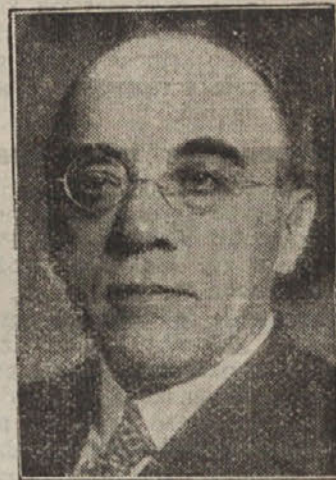
Senator Sarraut, ki je Lavalov naslednik in je že sestavil novo francosko vlado

nizacija se je na vso moč trudila, vendar pa je doživljala le razočaranje, tako da kakega vidnega izboljšanja ni moči zabeležiti. V lanskem letu je v Sloveniji objavilo svojo obrt nad 1000 mojstrov. Zapreti so morali svoje delavnice in razočarani nad vsem likvidirati. Če pa posežemo še nazaj, tedaj ugotovimo, da je v poslednjih 4 letih propadlo na 3500 obratov. Poleg samega gospodarskega položaja je obrtništvu nevzdržno breme tudi previsoka davčna obremenitev, ki nikakor ni v sorazmerju z gospodarsko močjo obrtniškega stanu. Iz nekaterih krajev poročajo posamezna obrtna združenja o nevzdržnem položaju, ponekod ga ni več člana, ki bi mu ne bili zarubljeni različni predmeti. Število rubežni za plačilo davkov je v letu 1934 znašalo 195.000, kar znači, da je vsaki drugi davkoplačevalec zarubljen. Zato obrtništvu upravičeno zahteva, da se davčna obremenitev zniža. K temu je treba še dodati akutno vprašanje sušmarstva. Tudi v tem oziru se doslej upravičenega obrtnika še ni zaščitilo kakor bi bilo potrebno. Seveda je neprijetna stvar tudi nelojalna konkurenca. Med najnevarnejšimi konkurenti obrtništvu pa so državna podjetja in razne druge ustanove, ki s pomočjo svoje zaščitene pozicije lahko pogubonosno konkurirajo obrtniku. Obrtnika je tudi hudo zadelo znižanje uradniških prejemkov. Kupna moč je s tem še