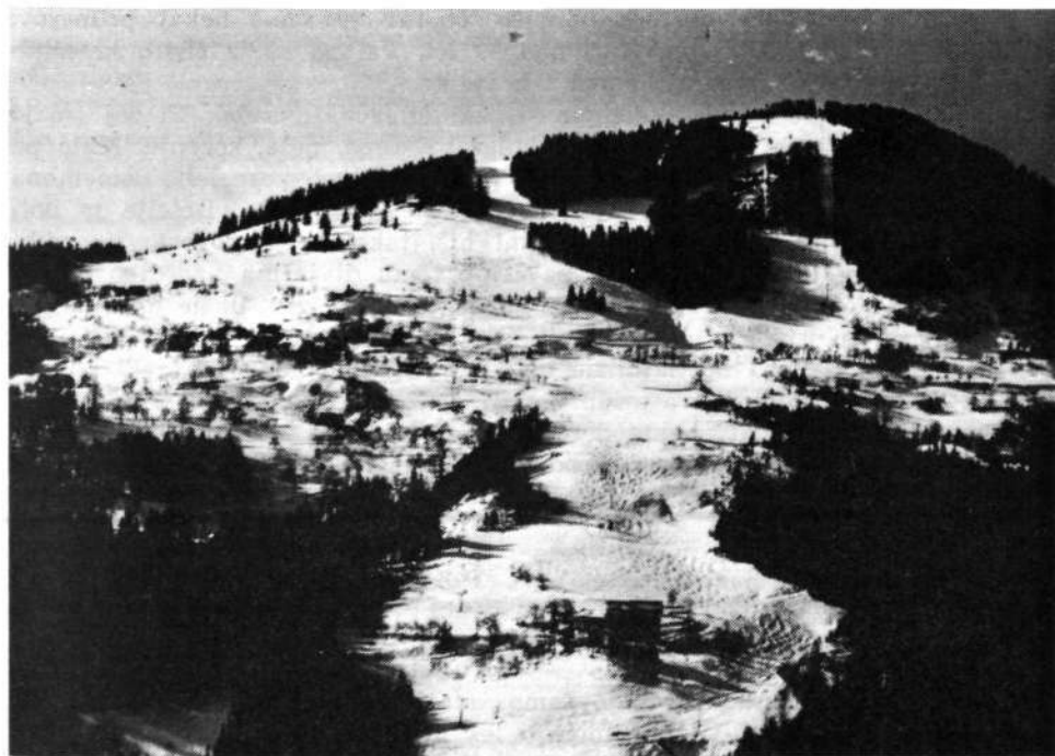
Smučišča na severnem pobočju Starega vrha, kjer sta si uspešno segla v roko kmetijstvo in turizem.

Specializacija ne uspe, če gospodarstvo ni opremljeno s kmetijskimi stroji. Osnovno obdelovalno orodje je kosilnica, zato je teh največ. Čez 70 % so opremljene s kosilnico kmetije v obeh KO. Razlika med mešanimi kmetijami in čistimi kmeti je pri obračalnikih in traktorjih. Tu imajo kmetje večjo stop-