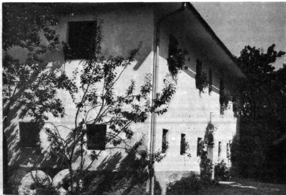
Domačija Pri mežnarju v Jarčjem brdu, ena med postojankami kmečkega turizma

Na izkoriščanje zemlje kmečki turizem ni bistveno vplival. Ponekod imajo nekoliko večji vrt, da lahko pridelajo vso potrebno zelenjavo, vendar to ne v večji meri, ker gospodinja nima časa za delo na vrtu. V hlevu je na