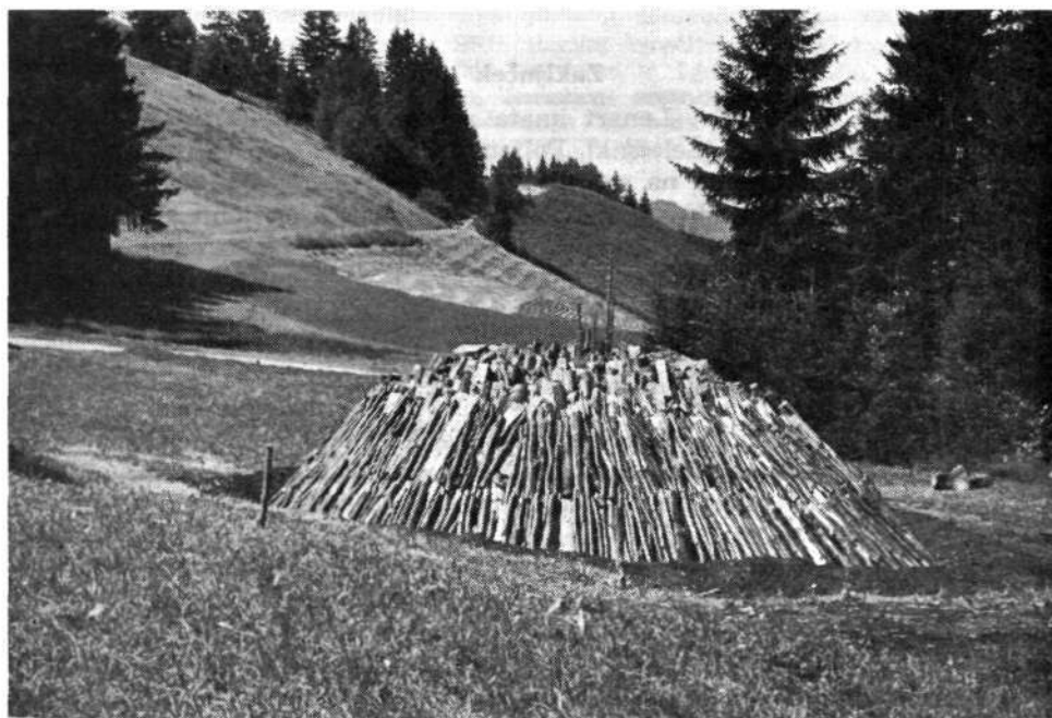
Oglarska kopa na Grebljici je simbolični spomin na nekdanje oglarjenje v okolici Starega vrha za potrebe železnikarskih žebjarjev.

Mešani kmetje so nekako v sredini. Če si vzamemo spet za primer Stirpnik, vidimo, da imajo mešane kmetije večji delež opremljenosti kot čisti kmetje. Kmetje nimajo toliko hladilnikov in ne kopalnic. Prav karakteristična je kopalnica. Kmetje jih imajo v zelo redkih primerih, bolj pogoste pa so v drugih gospodinjstvih. Tudi pri avtomobilih je podobna slika, le da tu izstopajo kmetje od Sv. Lenarta in Rovta. Iz vsega tega, kar smo sedaj spoznali, lahko vemo, da imata ta dva kraja ugodno prometno povezavo z dolino. V Rovtu je najboljša zemlja, kmetje imajo veliko posest, zato ni čudno, če so ti ljudje bolj situirani kot mešani kmetje iz drugih krajev.