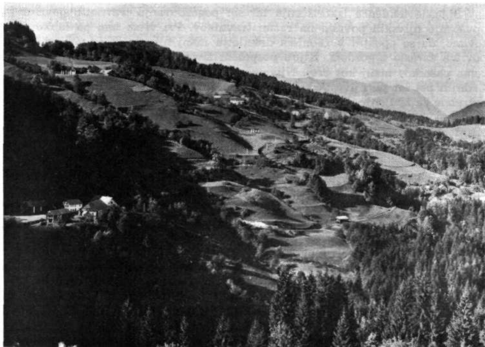
Severovzhodno pobočje Starega vrha s kmetijami vasi Rovt.

Prevozno sredstvo je večinoma moped. Z njim gredo včasih le do avto-busne postaje, ki je v dolini, naprej pa z avtobusom. Nekateri imajo pozimi v dolino tudi tričetrt ure. Drugi pa se vozijo na delo z avtomobili.