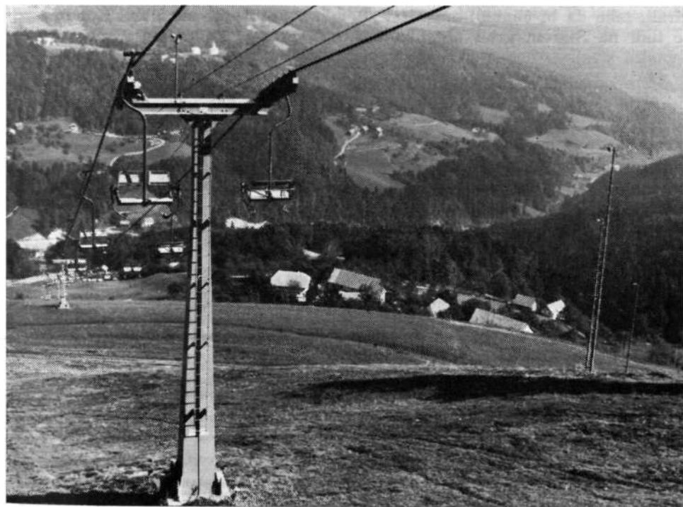
Sedežnica na Stari vrh nad vasjo Zapreval, v ozadju vas Lenart nad Lušo.

Podjetje Transturist (sedaj združen s Creino v Alpetour), ki se ukvarja tudi s turizmom, je leta 1970 zgradilo dvosedežnico in vlečnico na Stari vrh. S tem se je začela gradnja zimsko športnega centra. Leto kasneje je bila zgrajena še manjša vlečnica. Tereni so bili že prej prostrani, travnati, imajo pa osojno severo-severovzhodno lego, zato zadostuje že minimalna snežna odeja. Že to je utemeljevalo gradnjo centra. Stari vrh pa ima še druge prednosti pred nekaterimi drugimi središči. Od Ljubljane je oddaljen 37 km, kar je z avtomobilom 45 minut, od Kranja 36 km ali 35 minut, od Železnikov 14 km ali 20 minut, od Škofje loke pa 13 km ali 15 minut vožnje z avtomobilom. Smučar je torej iz teh krajev najprej na snegu na Starem vrhu. Krivavec je sicer tudi blizu Ljubljane, vendar si tu vezan na gondolo. Na Starem vrhu pa je dvosedežnica obenem tudi naprava, ob kateri se smuča. Na Stari