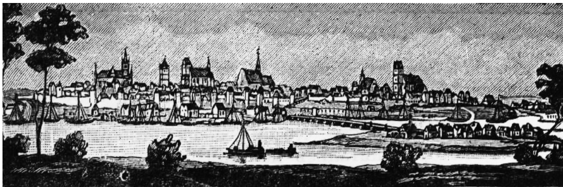
Slika 3: Torun (Torno, Thorn) v tedanji Prusiji na meji z Veliko Poljsko, kjer se je 19. 2. 1473 rodil Kopernik