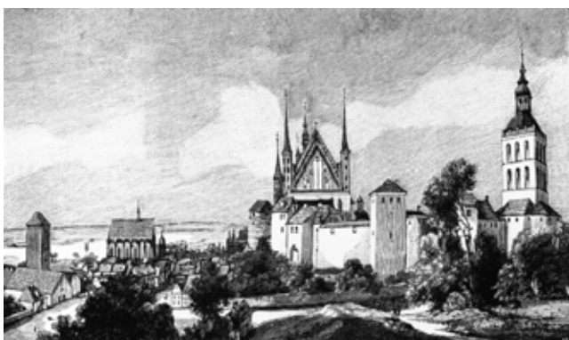
Slika 4: Frombork (Frauenburg) ob Baltiškem morju v tedanji Prusiji, današnji Poljski, kjer je 24. 5. 1543 umrl Kopernik

Atomi Demokrita, Epikurja in Leukipa so seveda predpostavljali obstoj vakuuma med delci snovi. Čeprav ni izrecno omenil vakuuma, je Kopernik z razpravo o atomih predpostavil njegov obstoj na Zemlji. Vprašanja o načinu gibanja planetov okoli Sonca brez trenja si še ni postavil, čeprav so tedanji raziskovalci o njem že pisali.