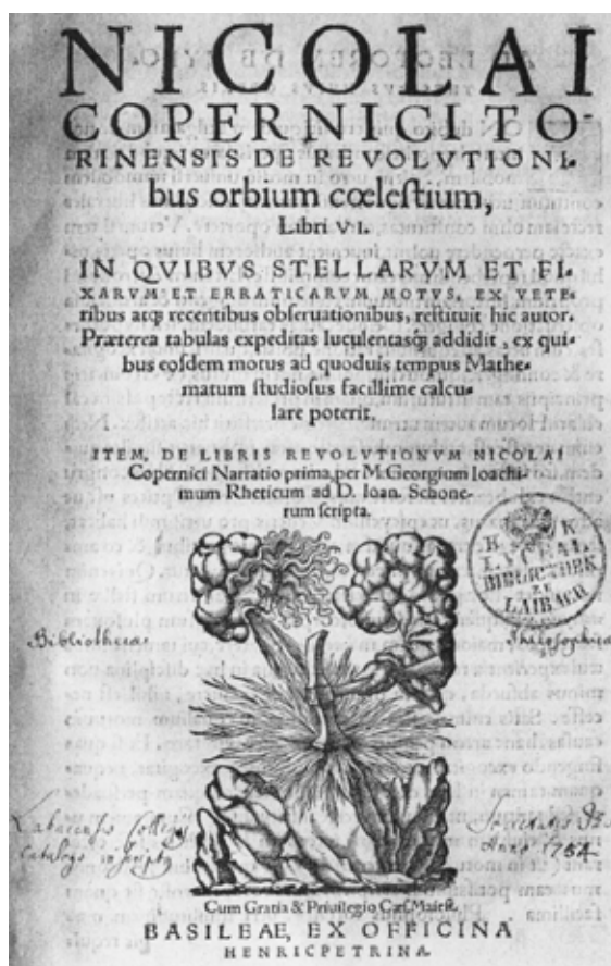
Slika 1: Naslovnica ljubljanskega izvida druge izdaje Kopernikovega dela iz leta 1566

Kopernik je imel vesolje oziroma Sončev sistem za neskončno velik v primerjavi z Zemljo. Razmišljal je tudi o nevidnih atomih, ki dosežejo opazljivo velikost šele, ko jih je dovolj veliko skupaj. 1