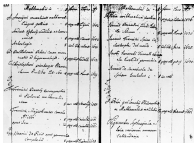
Slika 6: Predzadnja stran popisa matematičnega dela knjižnice prvega kranjskega vakuumista, kneza Turjaškega, in njegovega brata. Na drugem mestu levo navaja Kobavovo knjigo (ibid., 334–335)

vilna Portajeva dela, njegovo Magijo je imela kranjska družina Rechbach celo v dveh različnih natisih.