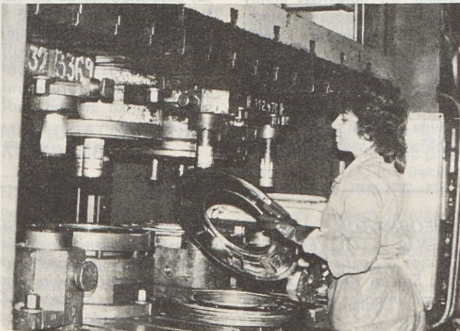
SOBOTA, 10. januar 1987—SOLIDARNOSTNI DAN

V tozdu Zamrzovalna in hladilna tehnika so v novembru mesečni delovni načrt presegli za 10 odstotkov in izdelali skupaj 56.118 zamrzovalno-hladilnih aparatov, katerih vrednost je 4.582.082 tisoč dinarjev. Izvozu so namenili 30.810 aparatov: 1.654 zaposlenih je v enajstih mesecih lani izdelalo 97 odstotkov z letnim načrtom predvidenih zamrzovalno-hladilnih aparatov, kar je kar 554.883 zamrzovalnih omar, skrinj, in hladilnikov, vrednih 39.170.780 tisoč dinarjev.