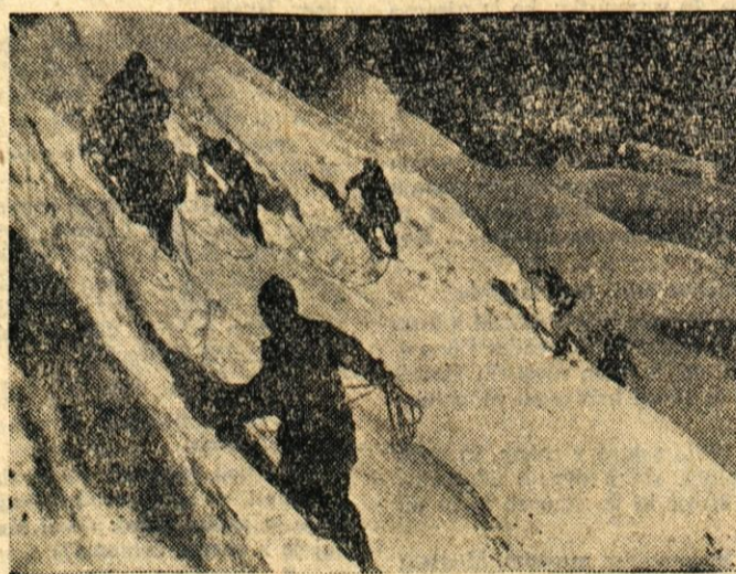
Ekipa plezalcem na trangu

Naša tričlanska ekipa je na gorenjskem zletu zasedla prvo mesto, kar je dokaz, da je kranjska eskadrila najmočnejša na Gorenjskem. Prav tako sta se dva člana udeležila velikega aero mitinga v Ljubljani in Zagrebu, kar je odraz kvalitete naših članov, saj je na teh mitingih sodelovala le elita jugoslovanskih pilotov. — P. T.