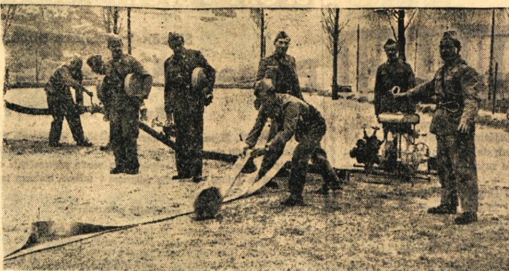
JESENICE, 23. marca - Prostovoljna gasilska četa jeseniške Železarnice se že pripravlja na različna tekmovanja. Najprej se bodo posamezne desetine v Železarni pomerile med seboj, najboljši bodo odšli na občinsko tekmovanje, od tam pa bodo izbrali reprezentanco za okrajno tekmovanje in nato za republiško. Naš fotoreporter je ujel desetine prostovoljnih gasilcev jeseniške Železarnice, ko so se urili pri polaganju cevi in v upravljanju z motorko. Nedvomno jim bodo pridobljene večšine precej koristile. Večkrat se je prostovoljna gasilska četa jeseniške Železarnice že izkazala, preprečila je že precej požarov in s tem prihranila precej denarja skupnosti

Oiševke, Senčur, Škofja Loka, Jesenice, Mlaka, Srednja vas, Predoslje, Sp. Brniki, Hamburg, München, dne 22. marca 1962