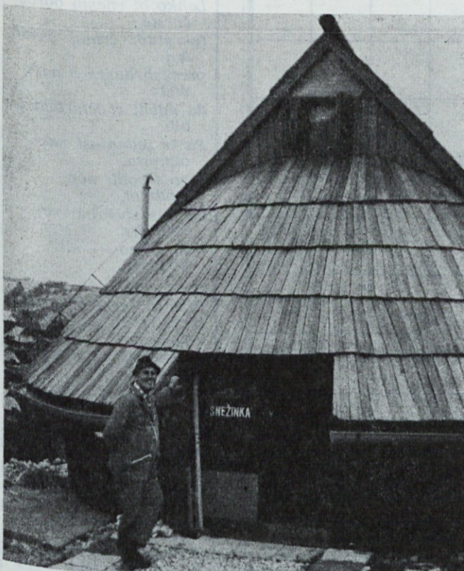
Kočica »Snežinka« na Veliki planini in njen gospodar Stane Šijanec.

Bliža se zima in človek nehoté pomisli na sneg in, če je še malo smučarja tudi na smučanje.