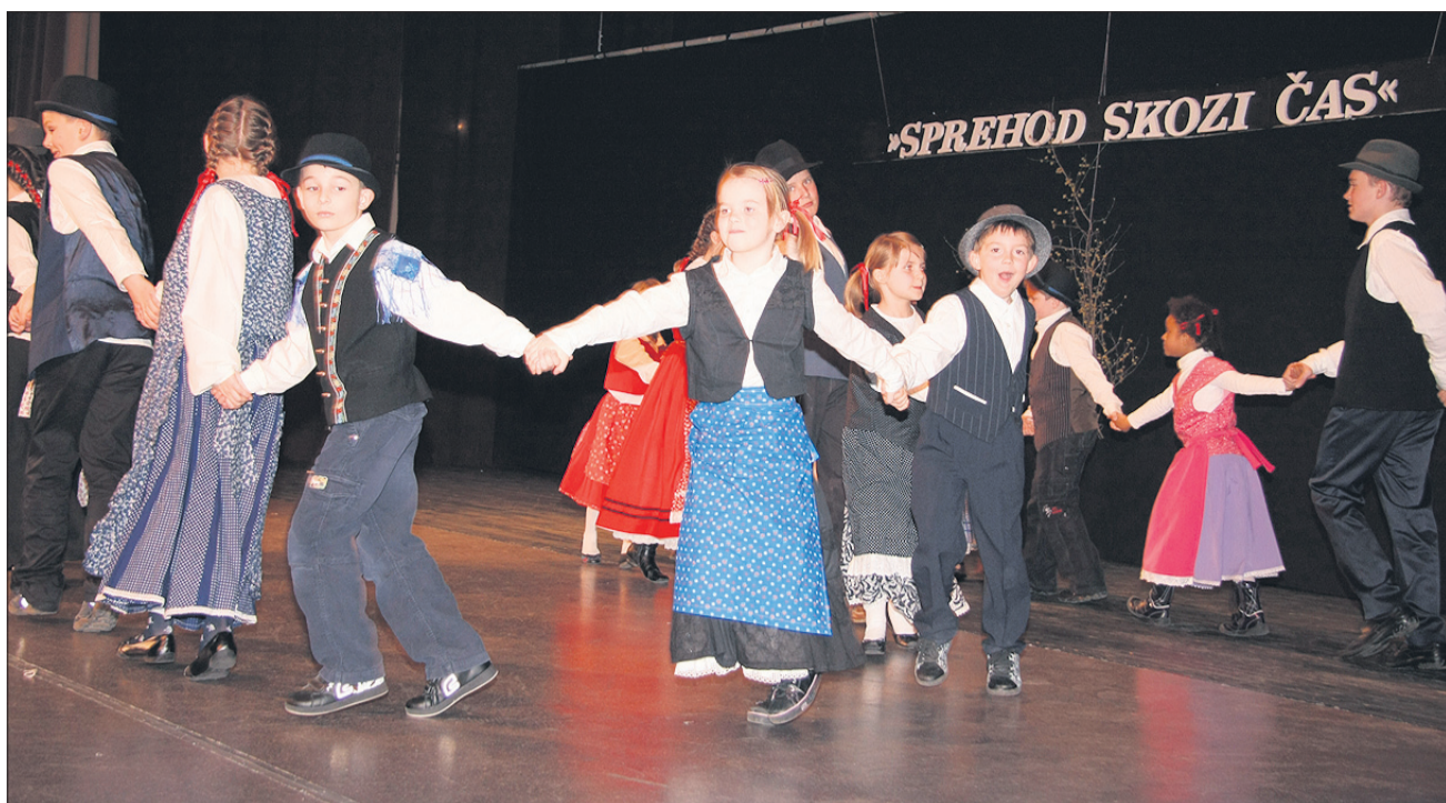
Člani FS Ponikva pri Žalcu med plesom, v katerem uživajo.