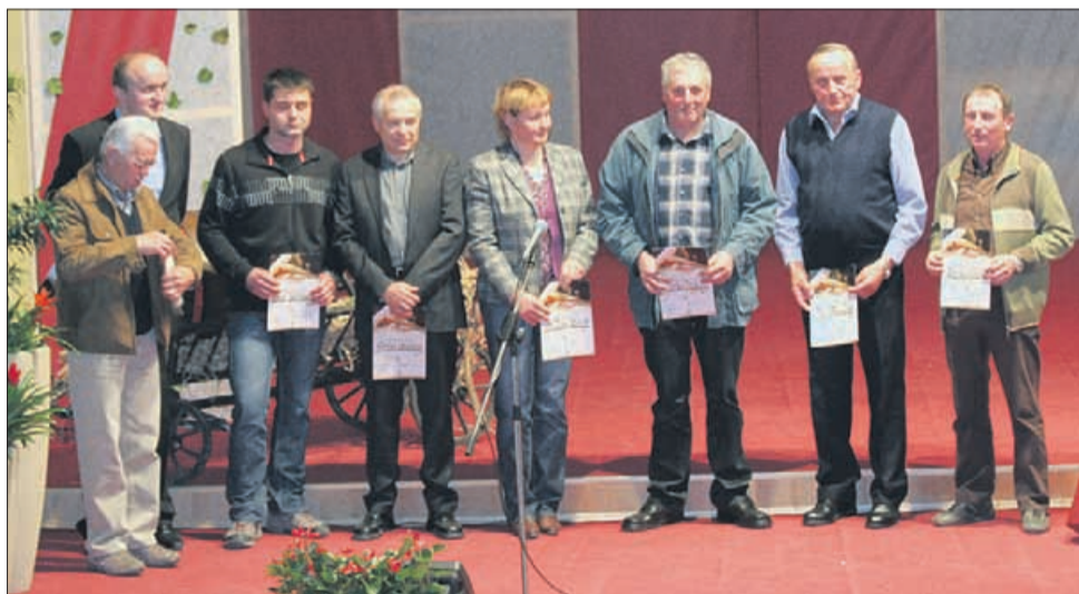
Slovesna razglasitev rezultatov ocenjevanja salam