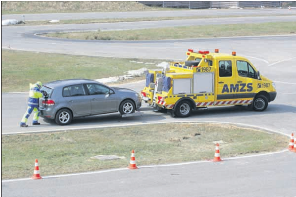
Preden prispe pomoč AMZS-ja, upoštevajte vsak korak za večjo varnost.