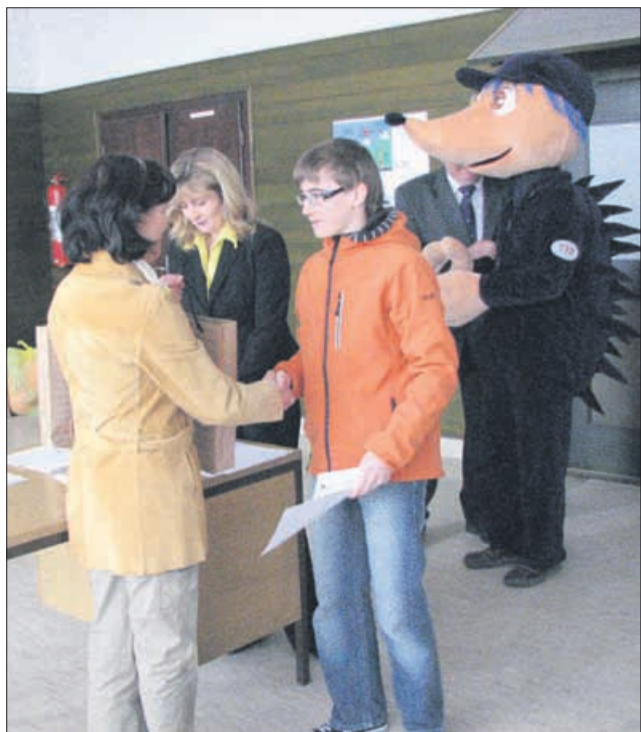
Najboljši so bili učenci OŠ Rogaška Slatina.