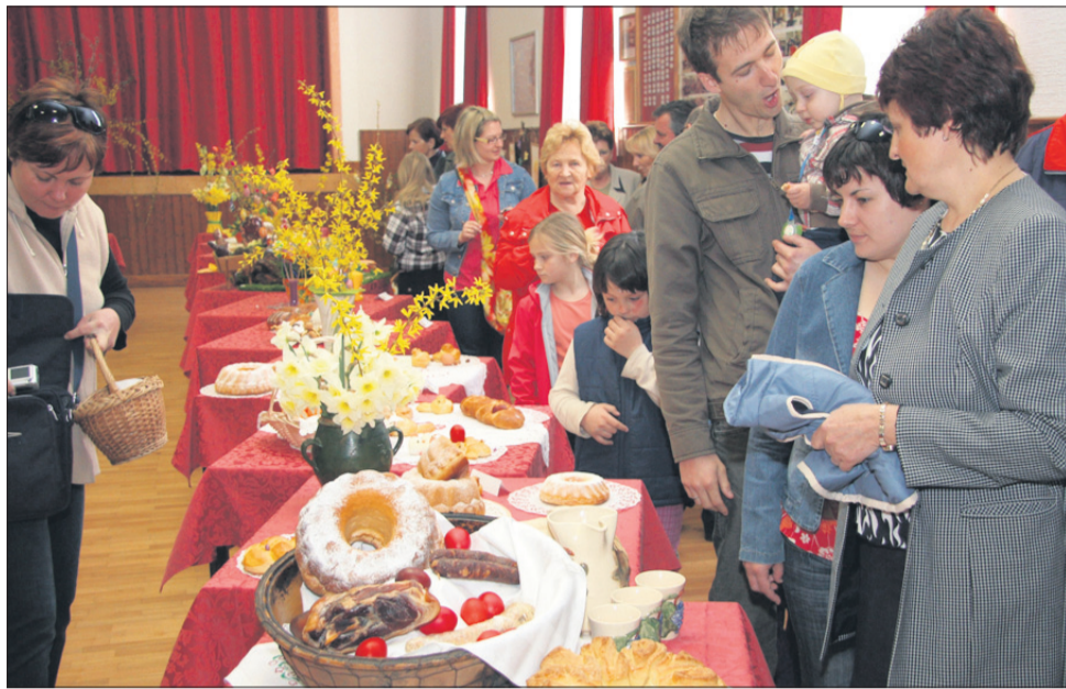
Svojevredna razstava je v Drešinjo vas privabila veliko obiskovalcev.