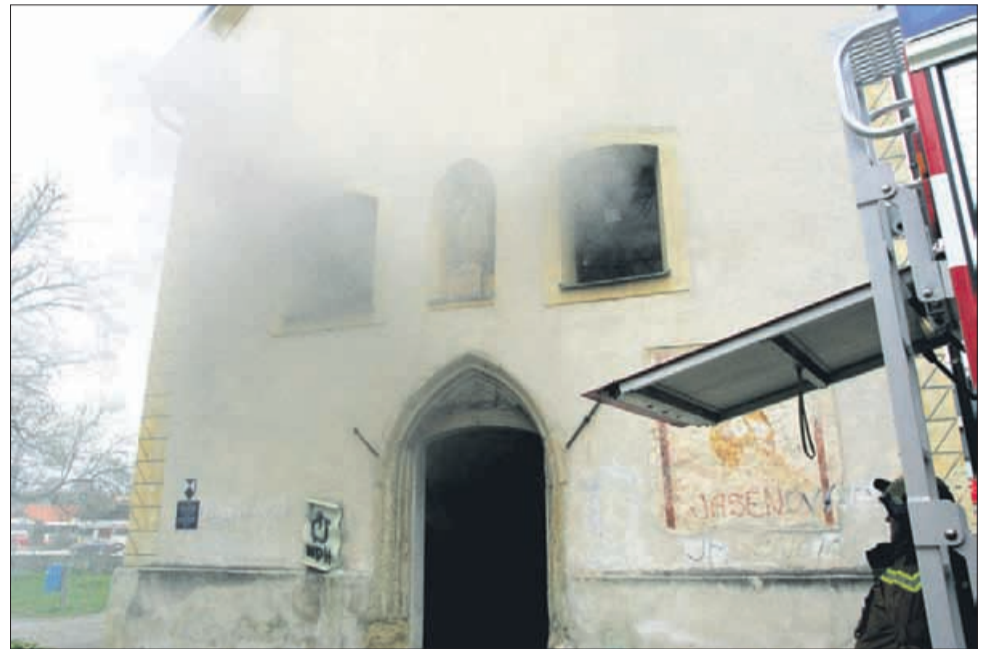
Gorelo je tudi v cerkvi na Mariborski cesti.