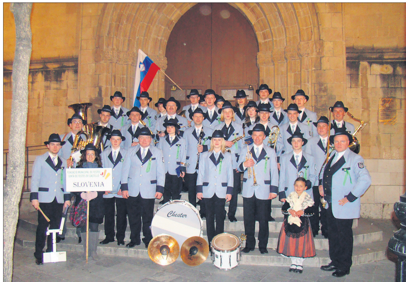
Štorski obrazi in slovenska zastava v daljni Španiji

65 let Z VAMI IN ZA VAS VSAK TOREK IN PETEK www.novitednik.com facebook/novega_tednika