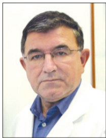
Piše: prim. JANEZ TASIČ, dr. med., spec. kardiolog

Vprašanje Petre: Po preboleli pljučnici sem utrujena in izčrpana. Že en mesec uživam vitamine, a brez uspeha, še vedno sem utrujena. Sosed uživa vsak dan žličko vitamina Q10, pa je poln energije, čeprav je starejši več kot 20 let. Ali naj tudi jaz poskusim? Ali ni to zdravilo za moško potenco? Kako vpliva na ženske po menopavzi?