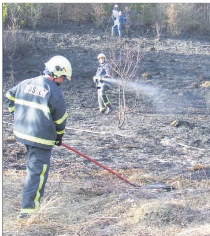
Suho spomladansko vreme in nevestno ter namerno ravnanje ljudi sta v zadnjih dneh razlog za mnogo travniških požarov.