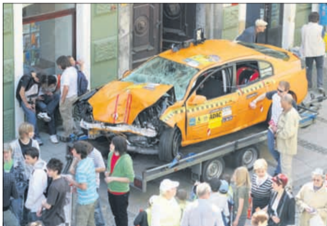
Takole je bilo lani.

Na Glavnem trgu v Celju bo jutri med 10. in 14. uro preventivna akcija Družinska ura. Organizirajo jo Avto-moto zveza Slovenije, Avto-moto društvo Šlander in Svet za preventivo in vzgojo v cestnem prometu Mestne občine Celje. Prireditelj je že tradicionalna, saj jo pripravljajo že petič. Tudi letos bodo največ poudarka dali na osveščanje mladih voznikov, predvsem voznikov motorjev, ki jih je ta čas vedno več na cestah.