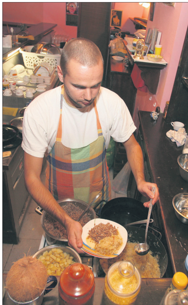
Bodo starši s peticijo dosegli, da bodo tudi šole in vrtci imeli vegetarijanske jedilnike?