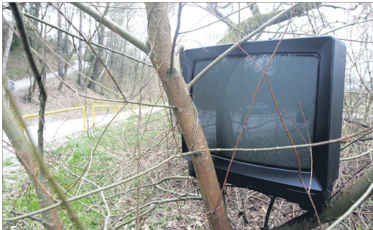
Televizija pod Gričkom