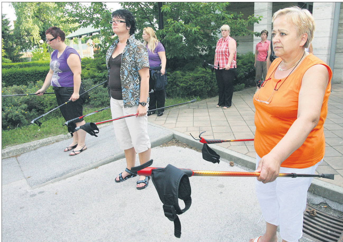
Med aktivnostmi ob svetovnem dnevu zdravja bodo v Celju, Laškem in Slovenskih Konjicah tudi prikazi nordijske hoje. Udeleženci naše akcije Hujšajmo z NT&RC so se hoje s palicami takole lotili maja lani.