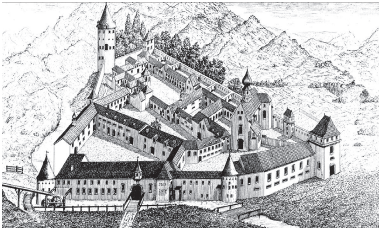
Žička kartuzija v prvi polovici 18. stoletja (M. Zadnikar: Romanske cerkve v Sloveniji)