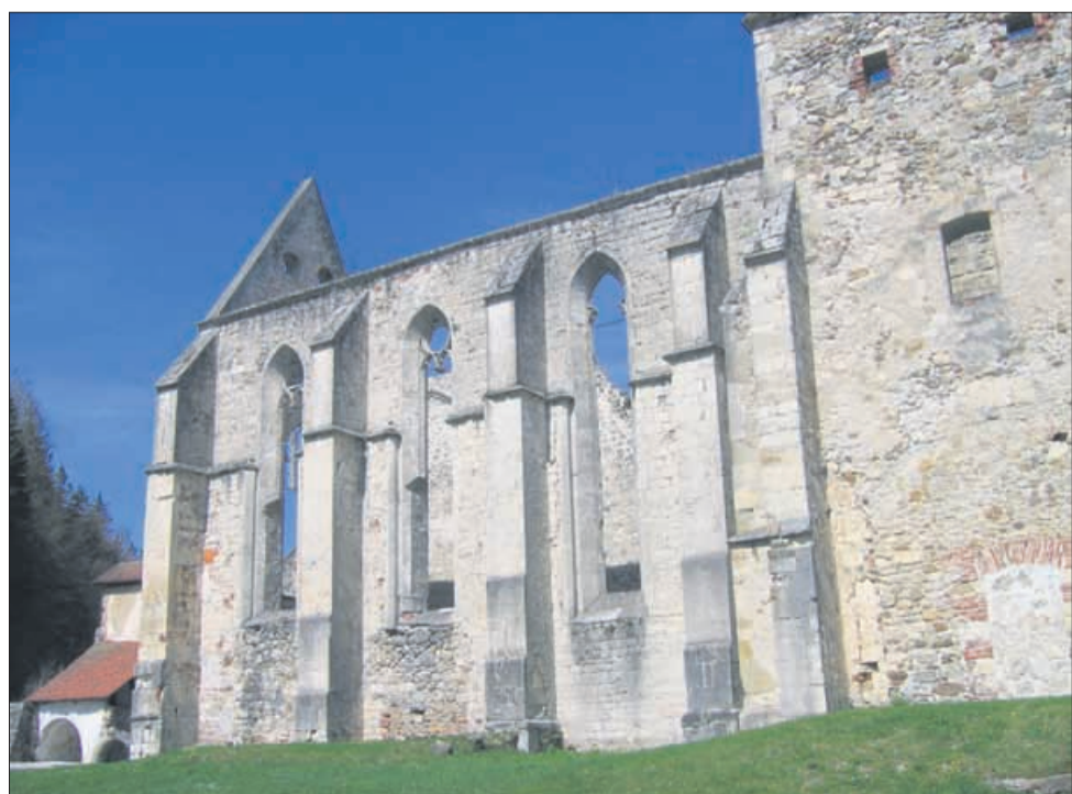
Cerkev sv. Janeza Krstnika