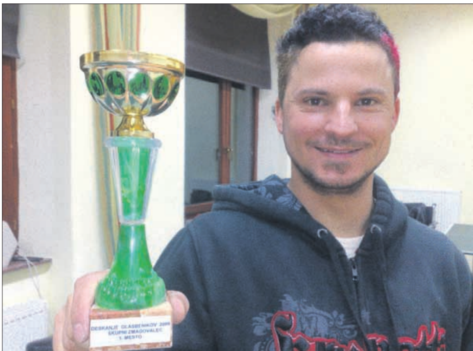
Glasbenik in športnik je vselej znal prisluhniti stiski ljudi.