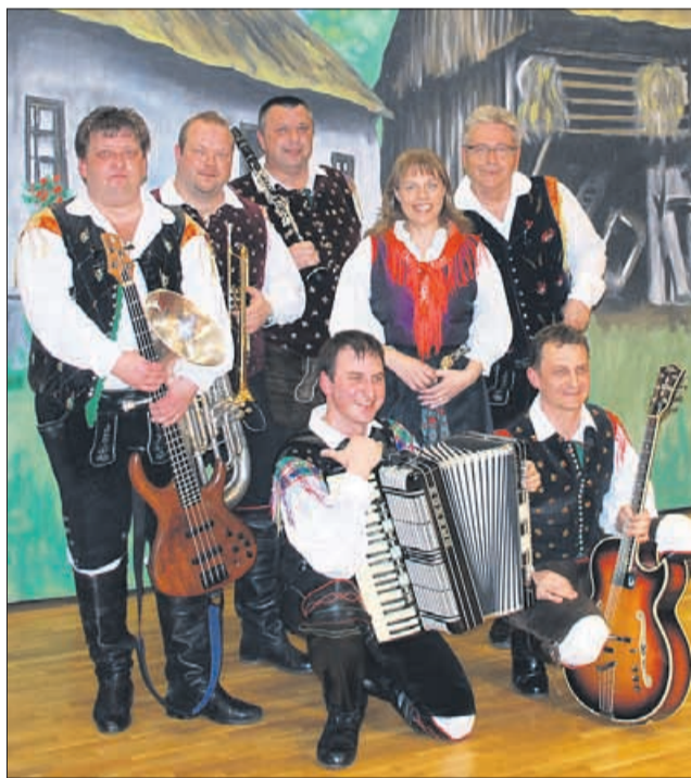
Slovenski muzikantje so upravičili vlogo osrednjega gosta na 19. reviji Ostanimo prijatelji.