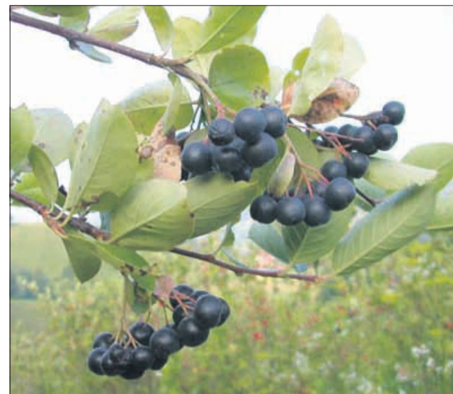
Z uživanjem aronije se povečuje tvorba koencima.

CoQ10 ima pomembno vlogo na razvoj različnih boleznih - dokazali so vpliv na delovanje srca, razvoj rakastih boleznih, pri izjemnih naporih, alergijah, boleznih centralnega živčnega sistema ... Te bolezni so lahko tudi posledica povečane količine FR - prostih radikalov, kar CoQ10 nevtralizira. Po jemanju koencima se izboljša spomin, manj je alergičnih napadov astme, degenerativne bolezni možganov napredujejo počasneje, manj je glavobolov in odpovedi srčne mišice. Veliko vlogo ima pri preprečevanju ateroskleroze. Ni opaziti pomembnih stranskih učinkov, a ga ne priporočamo med nosečnostjo in dojenjem. Le redko pride do blagih gastrointestinalnih težav. Ne priporočamo ga bolnikom, ki so na antikoagulantni terapiji z marivarinom ali podobnimi zdravili. Pri sladkornih bolnikih so potrdili, da lahko povzroči lažjo hipoglikemično reakcijo. Fizična obremenitev poveča produk-