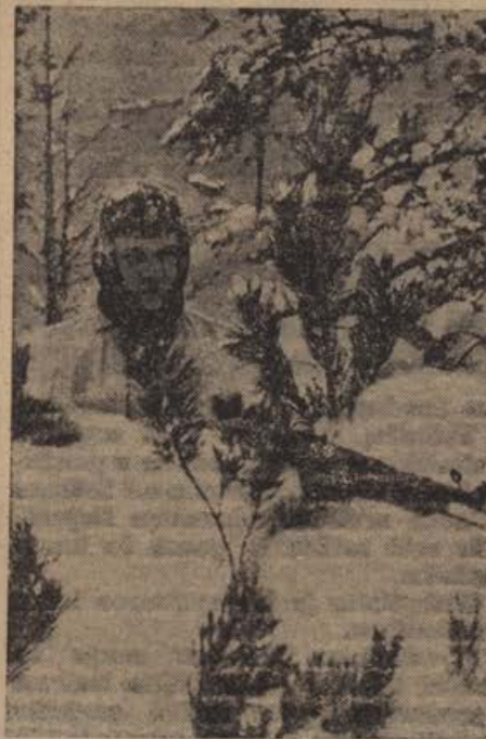
Hinter Schneewällen. Die vordersten Sicherungen unserer Abwehrfront im Osten halten den Feind beständig im Auge

padel bistveni faktor borbe proti Japonski. Ako bi se po Rooseveltovem mnenju prekinila zveza z Jugozapadnim Pacifikom, bi padli Avstralija in Nova Zelandija pod japonsko gospodstvo. Ako ameriški vojni material ne bi mogli več pošiljati v Anglijo ali Rusijo, v Sredozemsko morje in Perzijski zaliv, bi Nemci po Rooseveltovem mnenju pohodili Turčijo, Sirijo, Irak, Iran, Egipt, Sueški prekop, vso Severno Afriko in vso zapadnoafriško obalo. Ako ne bi bilo mogoče ščititi severoatlantiško črto v Anglijo