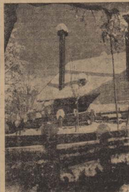
Winterzauber. Ein verschneiter Bauernhof in den Salzburger Alpen.

Razen masti živalskega izvora imamo tudi maščobe rastlinskega izvora, ki jih dobivamo iz semen oljnatih rastlin: buč, sončnic, repice ogrščice, konoplje, maka i. t. d.