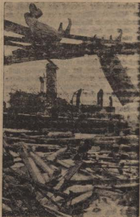
Das war einmal ein Sowjettransporter. Neben mehreren anderen Sowjettransportern, die Kriegsmaterial geladen hatten, wurde auch dieses Schiff im Hafen von Feodosia versenkt.

Mit einem Male rauscht merkwürdig torkelend ein Bomber über einen Flügel flatternd aus den Wolken, wahrscheinlich der Abschub eines unserer Jäger. Erst einer, dann rufen zwei und immer weiter anwachsend pflanzt sich der Jubelaufschrei übers Deck: Ohne Leitwerk, sonst aber anscheinend unbeschädigt, zischt die Maschine unter eigenartig zuckenden Bewegungen abwärts und verschwindet knapp zweihundert Meter hinter uns und mit hochaufpeitschender Gischt sekundenschnell in der brodelnden See.