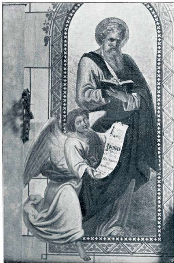
WOLF: SV. MATEJ freska na Vrhniki

deja in sv. Pavla, na desni sv. Janeza in sv. Petra, v sredi pa na platno slikanega sv. Jakoba, na vrhu pa Marijo, ki jo spremljajo angelci v nebesa. Wolf je naslikal sv. Petra in Pavla in simbolične skupine, poočitujoče tri božje čednosti: vero, upanje in ljubezen. Simbol vere je posebno globoko zamišljen: Mati žaluje za svojim umrlim otrokom, angel ji pa kaže s prstom v višavo, češ da najde tolažbo v veri, ki nas uči, da je večno življenje in da se bomo zopet videli. Za vzor je Wolfu služil kameniti oltar