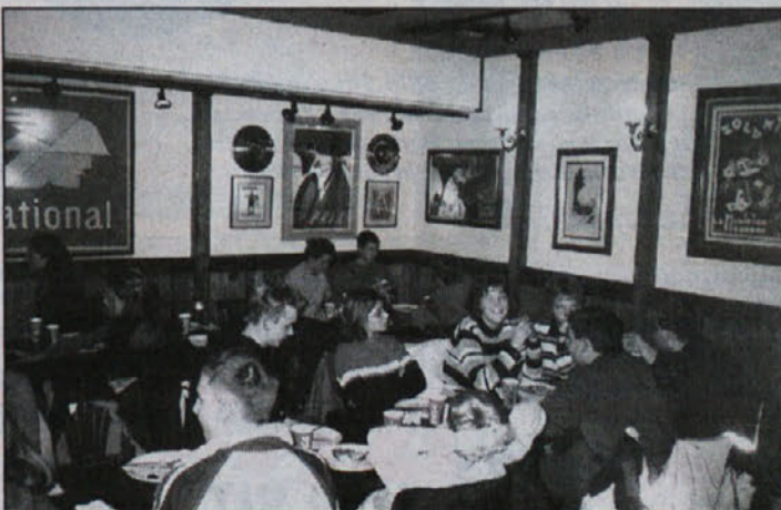
Tega pa pri nas ni. Za pet funtov smo jedli, kolikor smo hoteli. Seveda smo najprej poskusili različne vrste pic, za testenine pa v žlezcih že ni bilo več prostora. Coca cola mora biti obvezno zraven. Pa naj še kdo reče, da "fast food" ni dober. "It's the best!"