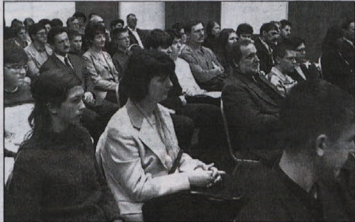
Novi Zoisovi študenti skupaj s svojimi starši na svečanosti ob podelitvi certifikatov