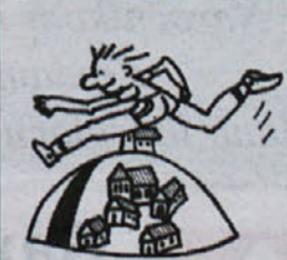
Kar malce nestrpno smo čakali na podzemni vlak, kajti vedeli smo, da hitro pripelje in še hitreje zapre vrata in odpelje. A mi smo hitro skočili nanj, kajti izgubiti se v Londonu ni najbolj prijetno.