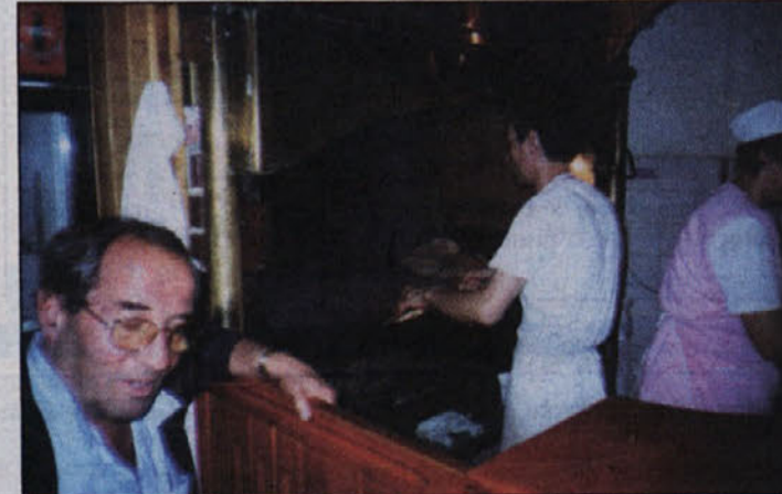
Mi smo poizkusili čevapčiče "Kod Želje" (lokal se imenuje po sarajevskem nogometnem prvotligašu Željezničarju).

Na Baščaršiji najdete tudi kavana ali kafane in celo kahvane, v katerih vam pripravijo tisto kavico v dežvi, z ratlukom (poseben sladke dodatek, podoben želeju) in kocko sladkorja. Če tam ne najdete Čevabdžinice ali Burekdžinice, ste najbrž zamenjali Sarajevo za kakšno drugo mesto. Mi smo poizkusili čevapčiče "Kod Želje" (lokal se imenuje po sarajevskem nogometnem prvotligašu Željezničarju), kjer so po Veljkovih