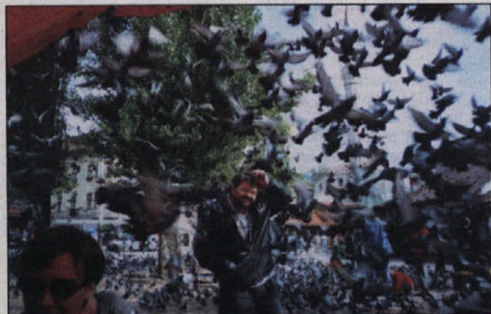
Golobi na Baš čaršiji