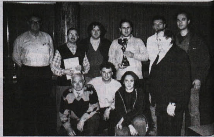
Zmagovalna ekipa ŠK Milan Majcen Sevnica