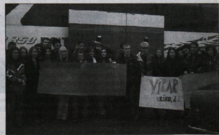
Gimnazijci pred odhodom v Francijo

Gimnazija Brežice sodeluje tudi v programu ES-COMENIUS pri projektu Narodna kultura in identiteta, ki se odraža preko njihovih navad, tradicije in umetnosti. V projektu sodeluje pet srednjih šol iz štirih držav: Španije, Italije, Norveške in Slovenije. Prvi delovni sestanek mentorjev pa bo že ta mesec v kraju Logron v Španiji. T.J.