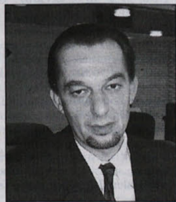
omenjen položaju, pa je začel kot natakark pred dvema desetletjema.

Brežičan med dobitniki je v gostinstvu že od leta 1973, v Termah Čatež, kjer je zadnja štiri leta na