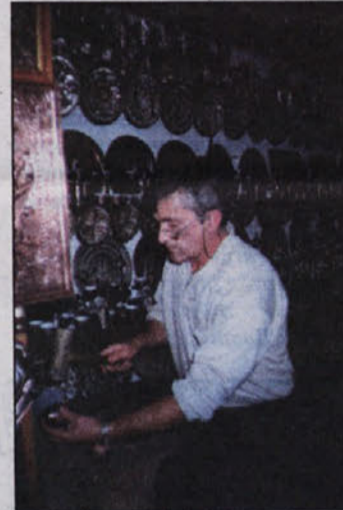
Obvezen je ogled kazandžijskih delavnic in prodajaln, kjer delajo tako znane "džezve", pa "ibrike", pladenjke in podobne reči.

mu pravimo tudi mi. Burek je le mesni burek. Dve vrsti obstajata. S sesekljanim in mletim mesom. Naš "sirov burek" se tam imenuje simica, imajo pa tudi krumpirušo in zeljanico (v tej najdete blitvo ali špin-