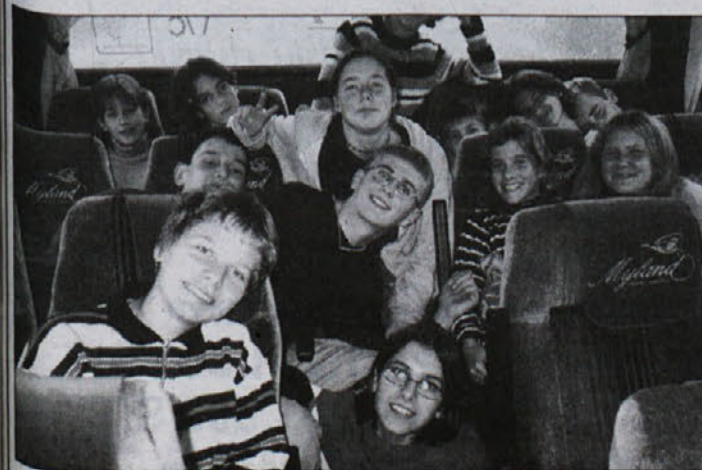
Na avtobusu se je dogajalo največ. Spalo bolj malo, a energije je bilo dovolj. Sicer pa, mi smo mladi in kaj bi spali!