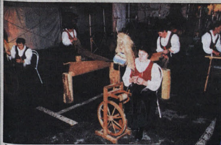
Žene iz aktiva kmečkih žena so se predstavile kot predice.

Šentjernejski, Ljubljana - Na povabilo trgovine Interspar BTC iz Ljubljane je Občina Šentjernejski pripravila praznovanje martinovega pred Intersparom BTC v Ljubljani.