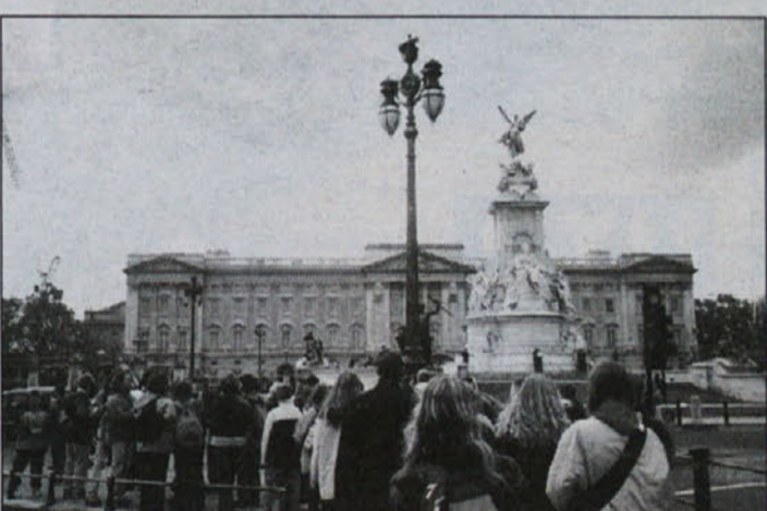
Buckingham Palace - dom angleške kraljice. Saj bi nas povabila na čaj ob petih, a kaj ko smo še toliko morali videti. Pa kdaj drugič, "the queen".