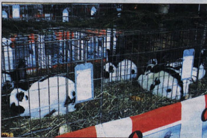
Med mnogimi razstavljenimi živalmi so bili zanimivi tudi kunci. Najmlajši obiskovalci so bili navdušeni nad predstavljenim, "zajčki" na fotografiji pa so jih spominjali na "dalmatinčke".