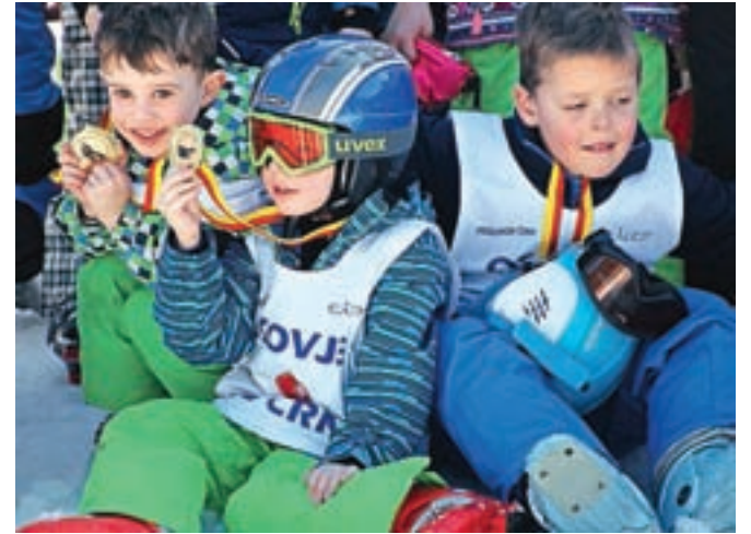
Tečaja so se udeležili otroci iz kamniške in tudi okoliških občin.

Za uspešno organizacijo tečaja smučanja pa so zasluženi tudi preostali člani, ki so poskrbeli, da je bila proga v Osovju kljub toplemu vremenu dobro pripravljena tudi s pomočjo umetne-