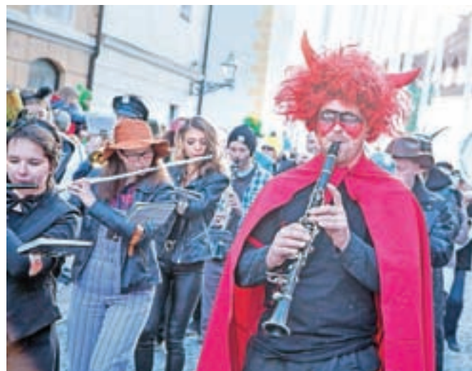
Našemili so se tudi člani mestne godbe in kamniških mažoret.