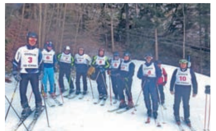
Skupina smučarjev pred startom

V prekrasnem sončnem petkovem dopoldnevu 15. februarja se nas je na smučišču Osovje Športnega društva Črna letos zbralo nekaj manj smučarjev, predvsem zaradi raznih virusnih obolenj. Odlično pripravljena veleslalomska proga je kljub nenavadno toplemu vremenu nudila nastopajočim pravi tekmovalni užitek, ki smo ga bili deležni v dveh vožnjah na čas. Za uvrstitev je štel boljši doseženi čas in marsikdo si je prav na ta na-