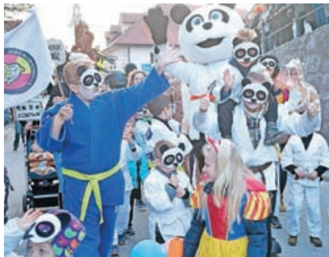
Na karnevalu smo tudi letos videli številne skupinske maske.