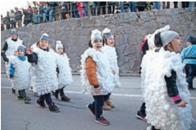
Medvedove ovčke