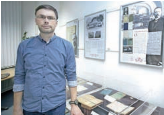
Avtor razstave Natisnil Anton Slatnar v Kamniku Andrej Kotnik

Razstava, na kateri je na ogled tudi nekaj prvotiskov, bo na ogled do konca marca.