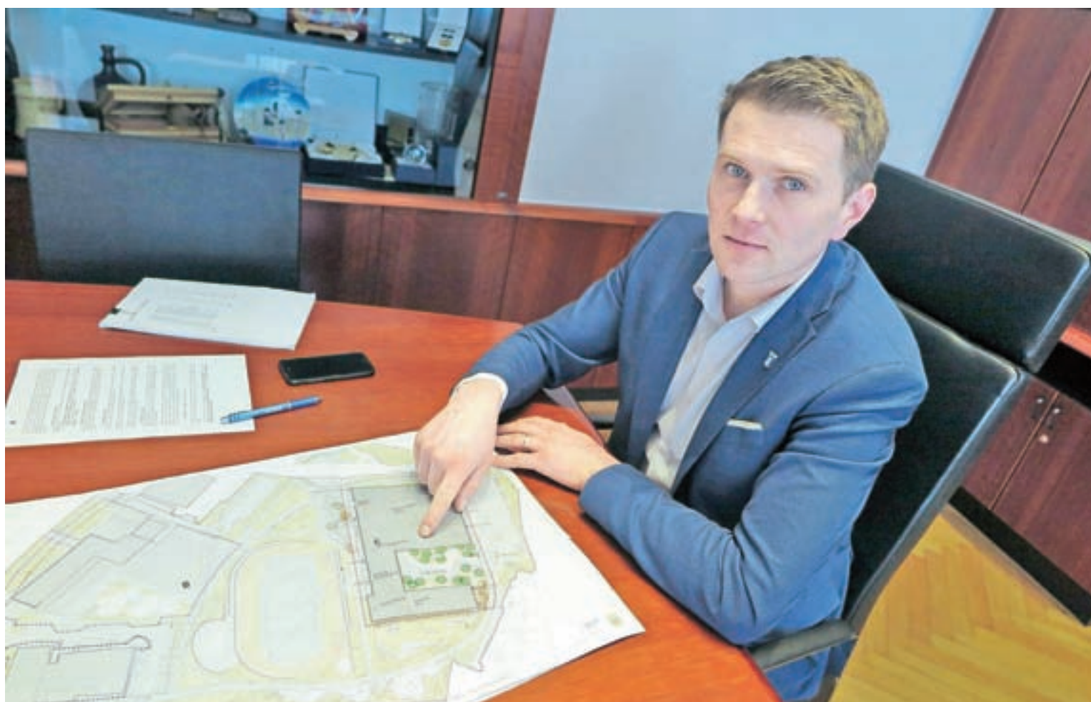
Župan s projektom nove Osnovne šole Frana Albrehta in športne dvorane, ki v tem mandatu ostaja prioriteta.

»To ne drži. Glede na to, da gradbeno dovoljenje še ni izdano (po dostopnih informacijah pa naj bi bilo tik pred izdajo), je nerealno pričakovati, da bi se gradnja šole začela letos, zato bomo v letošnjem proračunu kar se da največ sredstev namenili v sklad. Ko bomo gradbeno dovoljenje prejeli, bomo na seji občinskega sveta obravnavali idejne in investicijske projekte. Do sedaj občinski svet zavede še ni obravnaval. Takrat bo odprta javna razprava, vsak bo lahko povedal svoje mnenje, na podlagi tega bomo projekte potrdili in se lotili izbire izvajalca. A vse to bo možno izpeljati do konca leta, kar pomeni, da bomo gradnjo lahko začeli šele prihodnje leto. Tudi recenzije je še treba opraviti, da bomo prišli do realne cene. Ne vidim razlo-