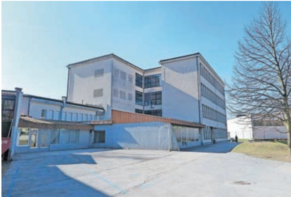
Stara stavba Osnovne šole Frana Albrehta

Na podlagi Poročila o preiskavah materialno-tehničnega stanja in analize potresne odpornosti objekta Osnovna