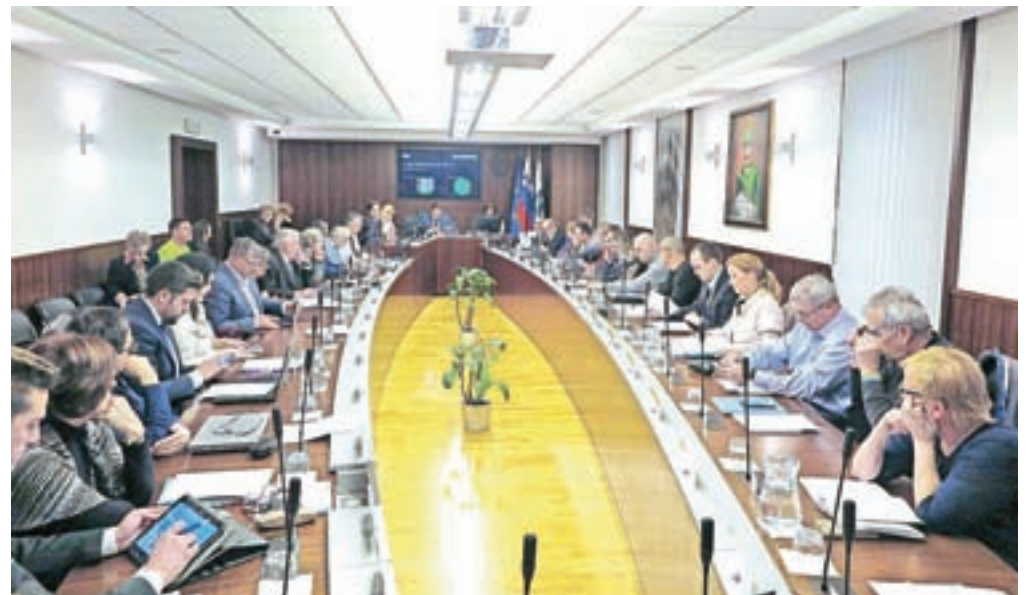
Pri obravnavi osnutka proračuna za leto 2019 so se svetniki neuradno že razdelili na koalicijo in opozicijo.