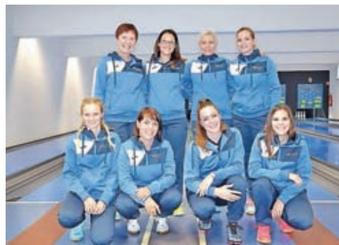
Ženska ekipa Kegljashaškega kluba Calcit Kamnik

Fantje so prav tako premagali ekipo iz Postojne z najmanjšo možno razliko – 4,5:3,5. Med našimi so odločilno vlogo odigrali Kristjan