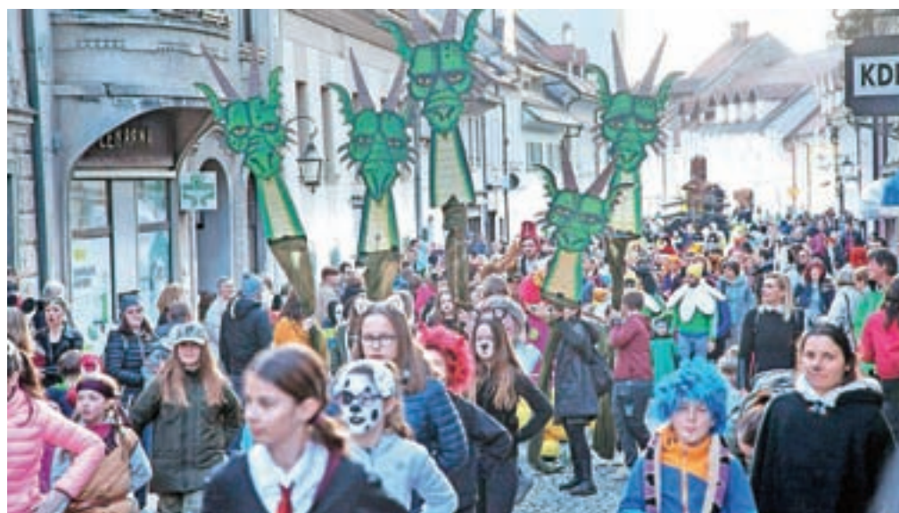
V pustnem sprevodu so bile tudi zanimive skulpture, ki so jih ustvarili člani nekaterih kamniških društev.

Kamniški Karneval, ki sta ga organizirala Zavod za turizem, šport in kulturo Kamnik ter Kulturno društvo Priden Možic, tako nadaljuje dolgoletno tradicijo pustnih karnevalov v mestu, ki sega še v čas pred drugo svetovno vojno. Že takrat je Kamniški občan namreč poročal o karnevalih, ki niso bili namenjeni le otrokom, temveč tudi odraslim, ki so se našemili v najrazličnejše izvirne maske. Med pustnimi šemami so namreč Kamničani lahko nekoč videli celo model dvokrilnega letala v naravni velikosti, ladjo z jambori, precej po-