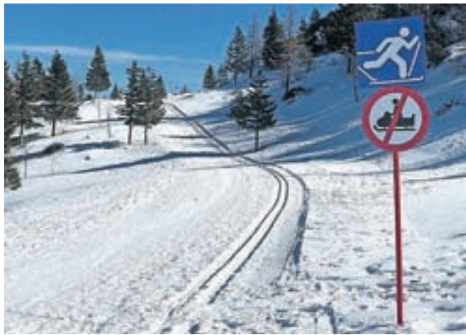
Na Veliki planini so to zimo prvič po dolgem času uredili progo za tek na smučeh.

velik izziv, predvsem v tem času, saj pomladne temperature hitro pobirajo sneg, teren je zahtevnejši in potrebnega je kar nekaj znanja in časa, da se proge pripravi tako, da so kakovostne ter varne. Kljub opozorilnim tablam ter oznakam na tekaških progah so velik del poti kaj hitro uničili motorni sankarji. Obveščamo jih, da je vožnja s sanmi po planini prepovedana, zato pozivamo k upoštevanju predpisov na območju Velike planine.« Na območju Velike, Male in Gojske planine je vožnja z motornimi sanmi prepovedana, razen po cesti do Kisovca, Podkrajnika, Mačkinega kota in Dola.