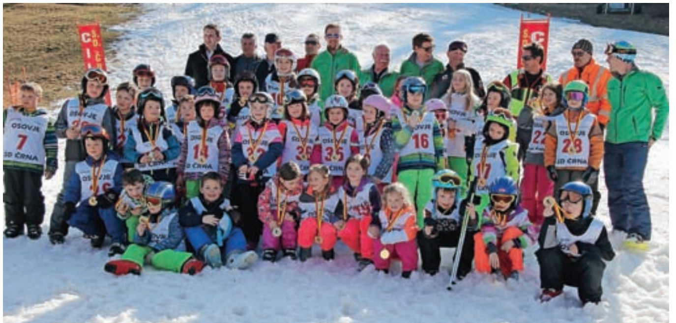
Člani Smučarskega društva Črna pri Kamniku so tudi letos organizirali tečaj smučanja za otroke.

niško službo ter poskrbeli za številne druge malenkosti za kvalitetno in dragoce- no izkušnjo udeležencev.