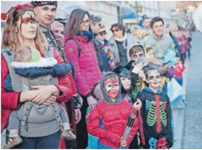
Med otroki so vselej priljubljeni junaki iz risank.