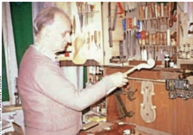
Skalarjeva goslarska delavnica v Kamniku