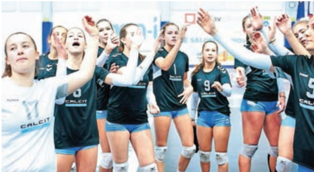
Druga ženska ekipa Calcita Volleyja, ki bo svojo prvo tekmo v zeleni skupini imela že jutri.

Za tri kamniške ekipe se zadnji krog državnega prvenstva ni končal ravno uspešno, saj so vse tri ostale praznih rok. Tako bosta prvi ekipi Calcita Volleyja končnico državnega prvenstva začeli že v četrtfinalu, druga ženska ekipa pa bo jutri, v soboto, tekmovalje v zeleni skupini začela s tremi točkami.