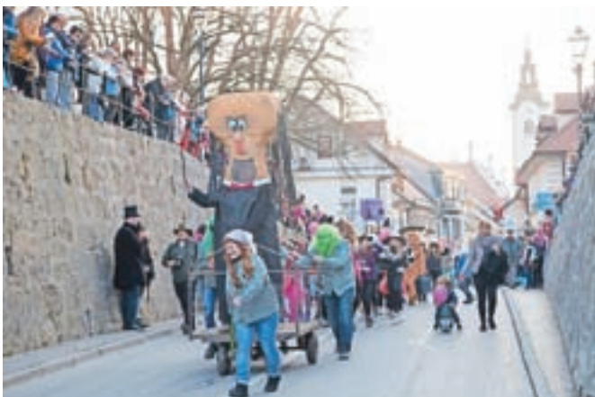
Kapitalist in njegovo spremstvo