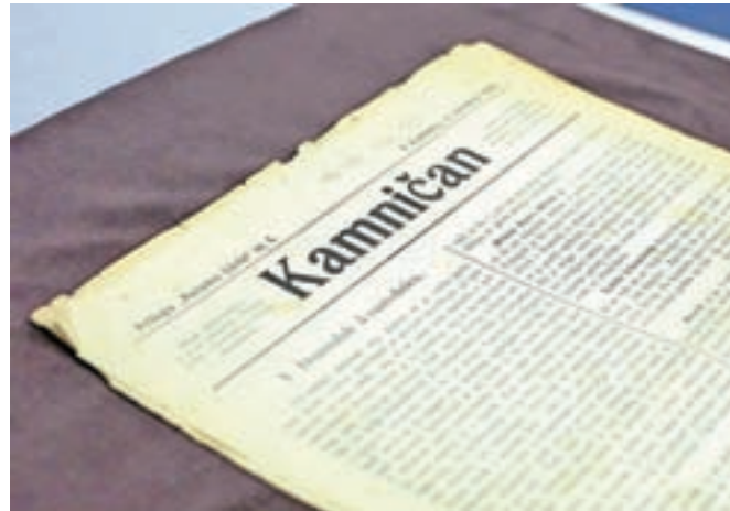
V Slatnarjevi tiskarni so med letoma 1905 in 1907 tiskali tudi prvo kamniško lokalno glasilo Kamničan.