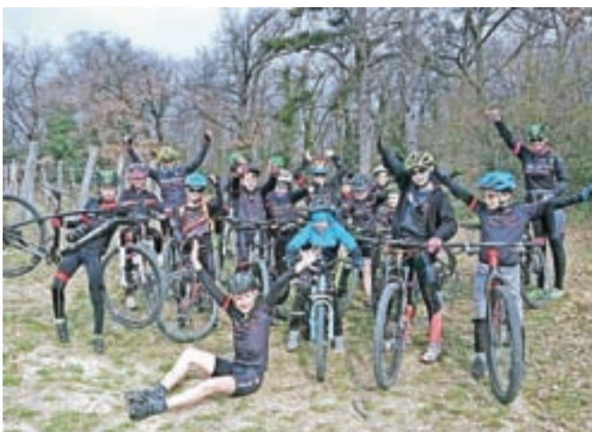
Mladi gorski kolesarji na pripravah