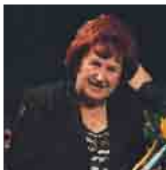
Kulturno društvo Senožeti