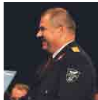
Poklicna gasilska enota CPV Domžale