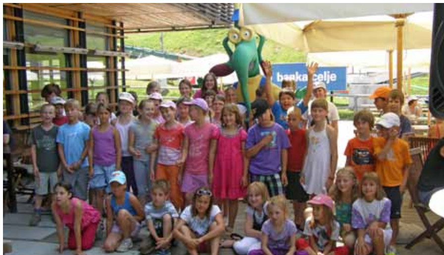
Nagrajence projekta je na Celjski koči obiskal tudi Ekorg

Projekt »Mladi v simbiozi z okoljem« je namenjen učencem, ki jih želimo s spletnimi igrami spodbujati k pravilnemu ločenemu zbiranju odpadkov. V prvi fazi smo zanje izdelali tri spletne igre (»Ločuj, varuj!«, »Smeti napadajo!« in »Poveži pare«), ki so brezplačno dostopne na spletni strani: www.mladizaokolje.si , ter promocijski material. Spletna stran je zelo dobro obiskana, saj smo zabeležili že več kot 5.000 obiskov, v povprečju pa se igralci iger na njej zadržijo 13 minut, kar je nad povprečjem.