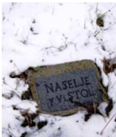
Arheološko najdišče Laška vas.

ogrlice iz raznobarnih steklenih jagod in fragmente posod hranijo v pokrajinskem muzeju v Celju in v muzeju v Gradcu.