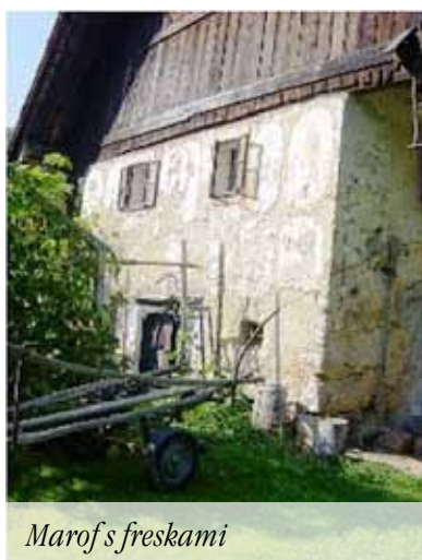
Marof s freskami