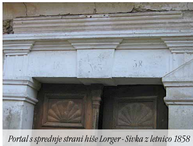
Portal s sprednje strani hiše Lorger - Sivka z letnico 1858