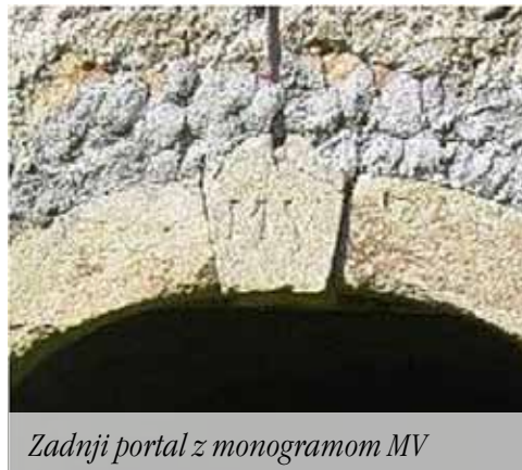
Zadni portal z monogramom MV

Domačini so povedali, da je bila tu nekoč zelo velika kmetija. V župnijskem uradu cerkve sv. Florijana na Teharjah je v arhivskem viru Status Animarum (Zapisniku duš, op. prev.) kot lastnik posestva na Pečovju 3 naveden priimek Zapečnik, kar se ujema z domačim imenom Zaplc oz. pri Zaplšk, ki se ga domačini še spominjajo.