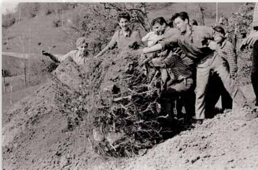
Gradnja nogometnega igrišča Lipa v Štorah med leti 1957 in 1959 - dijaki "ŠKIMCA"