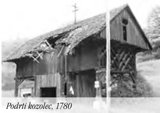
Podrti kozolec, 1780