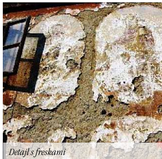
Detajl s freskami

Naša pozornost je namenjena dvema arhitekturno zelo zanimivima stavbama, ki prav tako stojita na Pečovju pri Štorah. To je kozolec, ki je žal že podrt in je imel letnico 1780, in marof (gospodarski objekt) s freskami. Obe stavbi sta nekoč pripadali istemu lastniku in sta stali na naslovu Pečovje 3. Pri marofu gre za edinstven primer v Sloveniji, kjer so na gospodarskem posloplju še ohranjene freske. Lastnik ga je prvotno imel za