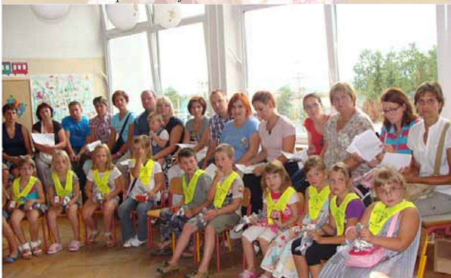
Rumene rutice za naše prvošolce