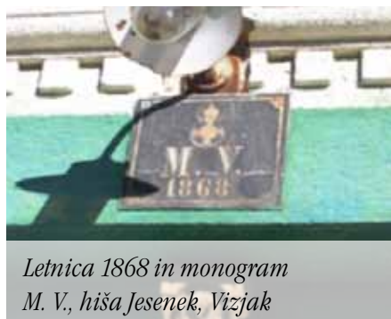
Letnica 1868 in monogram M. V., hiša Jesenek, Vizjak

H kmetiji je spadal še kozolec z letnico 1780, ki so ga kasneje prenesli ob glavno cesto Štore - Pečovje, na mesto, kjer se cesta odcepi proti Laški vasi. Kozolec je bil v registru ZVKDS in je bil naveden pod številko Laška vas 6A. Imel je še posebej zanimivo konstrukcijo s prostorom za spravilo sena (štulbuhom) pod streho. Delal ga je isti mojster kakor pečovski kozolec (kozolec družine Jesenek, nekoč Vizjak). Žal so ga pred dvema letoma podrti, ker se je nevarno nagibal proti cesti. Po pripovedi domačinov je bil poleg kozolca vhod v rudnik Pečovje. Poleg