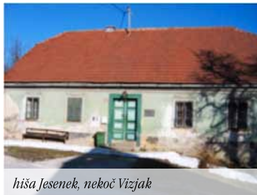
hiša Jesenek, nekoč Vizjak