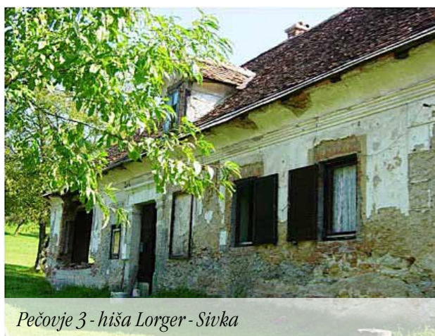
Pečovje 3 - hiša Lorger - Sivka

namembnost. V kleti je ohranjen vodnjak, nekoč pa je bila tam tudi lončena peč s kotlom. Lastnik je peč podrl, kotel pa še hrani pred hišo. Domačini se spominjajo, da je bila tu tudi gostilna. Kmetija je poleg hiše in marofa obsegala še dva kozolca. V smeri proti gozdu stoji kozolec, ki je imel prizidano kmečko peč, kjer so ženske peklo kruh. Nekoč so imele večje kmetije pogosto takšne peči za peko kruha. Tudi to leseno posloplje je imelo sobo za bivanje.