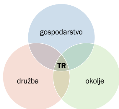
Slika 1: Trajnosten razvoj (TR) je mogoč samo ob uravnoteženem razvoju družbe, okolja in gospodarstva.

Za trajnostni razvoj (TR) je kar nekaj definicij, najbolj preprosta pa je definicija Svetovne komisije za okolje in razvoj (Brundtlandina komisija). Trajnosten razvoj po njej pomeni » zadovoljiti trenutne potrebe, ne da bi pri tem ogrozili zadovoljevanje potreb prihodnjih generacij « (Our Common Future, Oxford University Press, 1987). Gre za uravnotežen razvoj družbene, okoljske in ekonomske komponente.