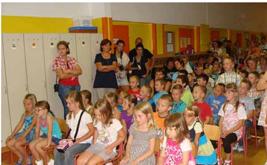
Prvošolci v velikem pričakovanju