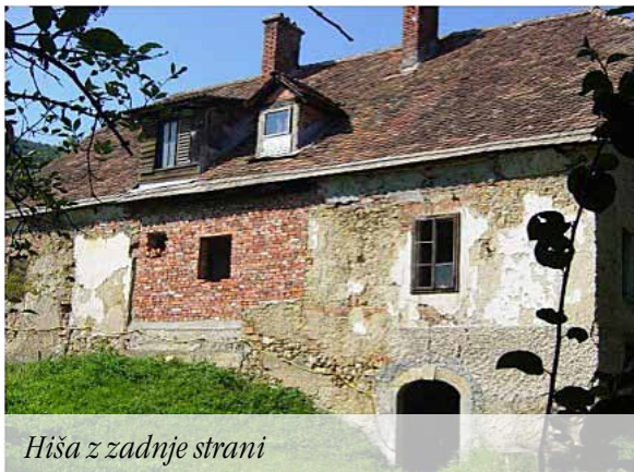
Hiša z zadnje strani