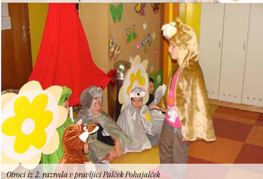
Otroci iz 2. razreda v pravljici Palček Pohajalček