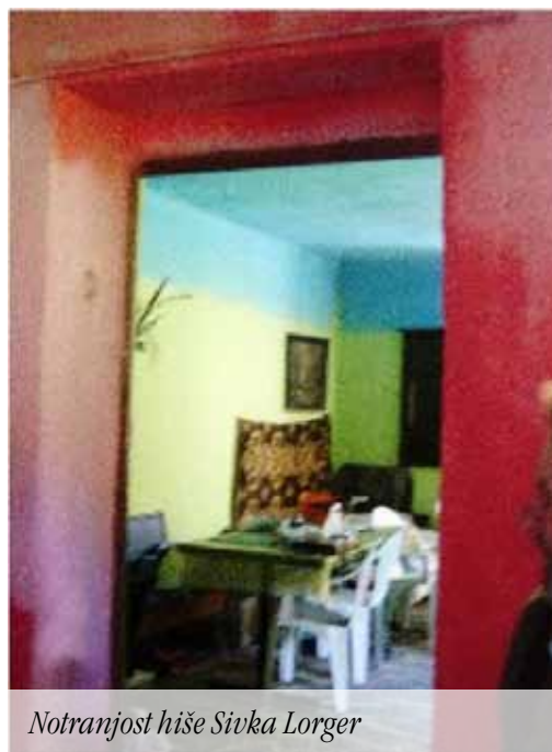
Notranjost hiše Sivka Lorger

Pozivam krajanje, da če imajo še kakšno zanimivo informacijo o marofu, naj se oglasijo.