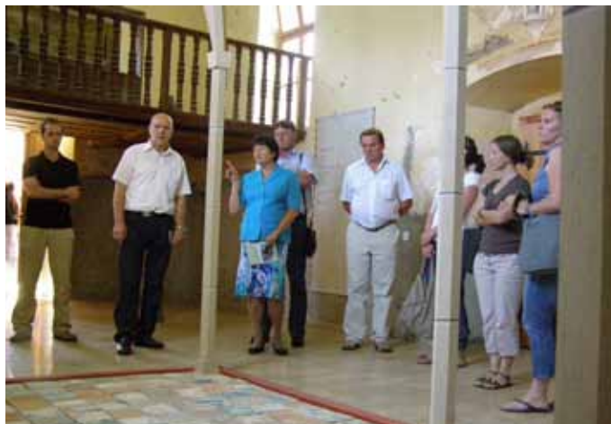
Slika: Cerkev Sv. križa, Svetina, Svetinski tlakovci

Posamezni »veliki in mali« lokalni turistični ponudniki s takšnimi in podobnimi akcijami pridobivajo svojo prepoznavnost, saj je danes pestrost turistične ponudbe tista, ki bo pritegnila goste v naše kraje. Menim, da so vse izbrane destinacije vredne obiska, s projektom Dežela celjska, ki ga vodi zavod Celeia Celje, pa se približujemo tudi destinacijskemu turizmu, kot ga poznajo v tujini.