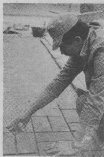
Polaganje ploščic

Trdno ostajamo pri svojem predlogu, da bi bilo gospodarno, če bi se