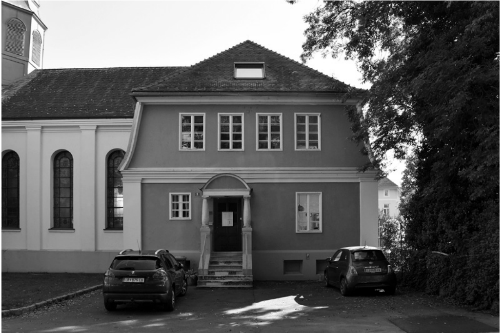
6 Otto Bartning, evangeličansko župnišče, 1911. Lipnica/Leibnitz

severni trakt pritličen. Arhitekturna členitev je preprosta, kar je pohvalil tudi anonimni pisec članka v tedaj precej razširjenem časopisu Marburger Zeitung . 23 Okna so pravokotne oblike, prvotno so se zapirala s polkni. Bogatejšo stavbno členitev imata le pritličje pročelja in južna stena severnega trakta, pri katerih podolžna pravokotna okna obdajajo slepe arkade, ki jih nosijo toskanski pilastri. Na enak način je obdan tudi vhod, do katerega vodi več stopnic. Severni trakt je krit s preprosto dvokapnico, medtem ko je streha glavnega, zahodnega trakta mansardna (sl. 2, 3). Prav takšen tip strehe in posledično izgled južne fasade, je tako rekoč razpoznavno znamenje župnišč iz Bartningovega zgodnjega opusa. Identično rešitev najdemo že v Peggau (sl. 4), prav tako se pojavi tudi na župniščih ob Allutherische Kirche v Essnu v Porurju (1909–1910), v Rottenmannu na Zgornjem Štajerskem (1910, kasneje razširjeno s prizidki) (sl. 5), Lipnici (Leibnitz, 1911) (sl. 6), Novém Městu pod Smrkem na severnem Češkem (1911–1912) (sl. 7), nekoliko modificirano rešitev z dodanim segmentnim zatrepom pa tudi v spodnjeavstrijskem Kremsu (1912–1913).