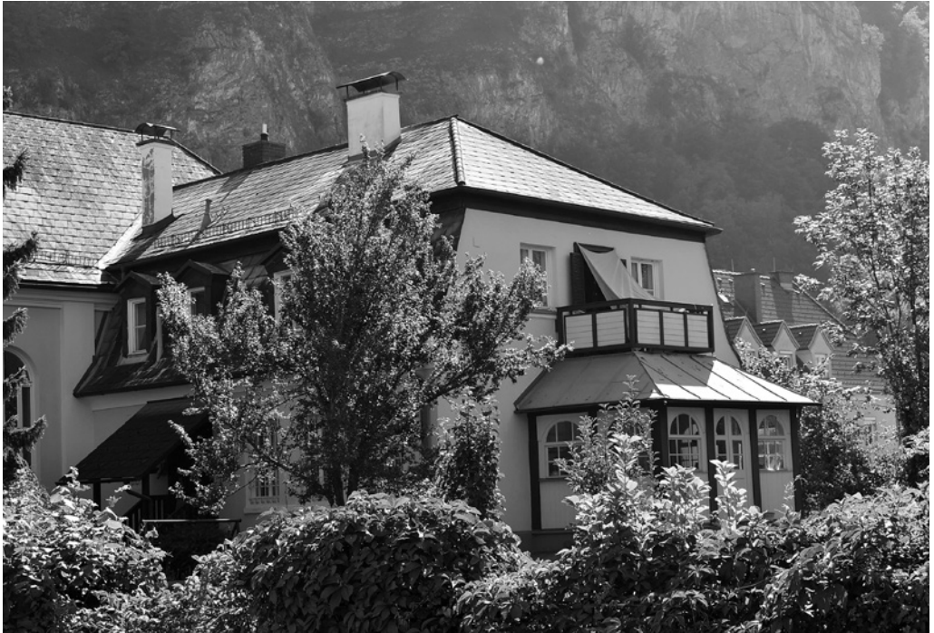
4. Otto Bartning, evangeličansko župnišče, 1906. Peggau

manjša enoladijska stavba z dokaj skromno arhitekturno členitvijo, katere pročelje sta na vzhodni strani poudarjala zvonik in relativno visok portal (sl. 1). 19 K zidavi župnišča, ki je vključevalo tudi župnijsko dvorano, pa so, verjetno zaradi finančnih razlogov, pristopili šele leta 1912, ko so ga 3. novembra tudi slovesno otvorili, načrte zanj pa je izdelal Otto Bartning. 20 Omeniti je potrebno, da