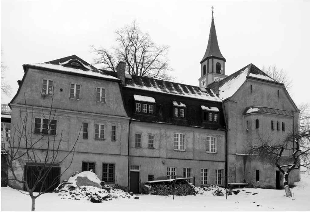
7. Otto Bartning, evangeličansko župnišče, 1911–1912. Nové Město pod Smrkem

Samo obliko radeljske stavbe lahko razložimo primerjalno z drugimi sočasni arhitekturnimi objekti, čeprav gre za edini primer, kjer je bilo župnišče dozidano k že obstoječi cerkvi. Pri snovanju cerkvenih novogradenj je Bartning namreč sledil sočasnemu dogajanju na področju nemške evangeličanske arhitekture, kjer je ob koncu 19. stoletja prišlo do novih pogledov na zasnovo sakralnih stavb, ki so ključno vplivali na arhitekturo protestantskih objektov v 20. stoletju. 24 Slednje najboljše ponazarja leta 1891 sprejeti Wiesbadenski program, katerega glavno vodilo je bilo, da cerkev ni božja hiša (v katoliškem pomenu besede), temveč prostor skupnosti. 25 Na teh izhodiščih so se leta 1906 v Dresdnu udeleženci drugega kongresa o protestantski cerkveni gradnji zavzeli za gradnjo objektov, ki bi pod eno streho združevali prostor za verske obrede, dvorano za prireditve kakor tudi stanovanje