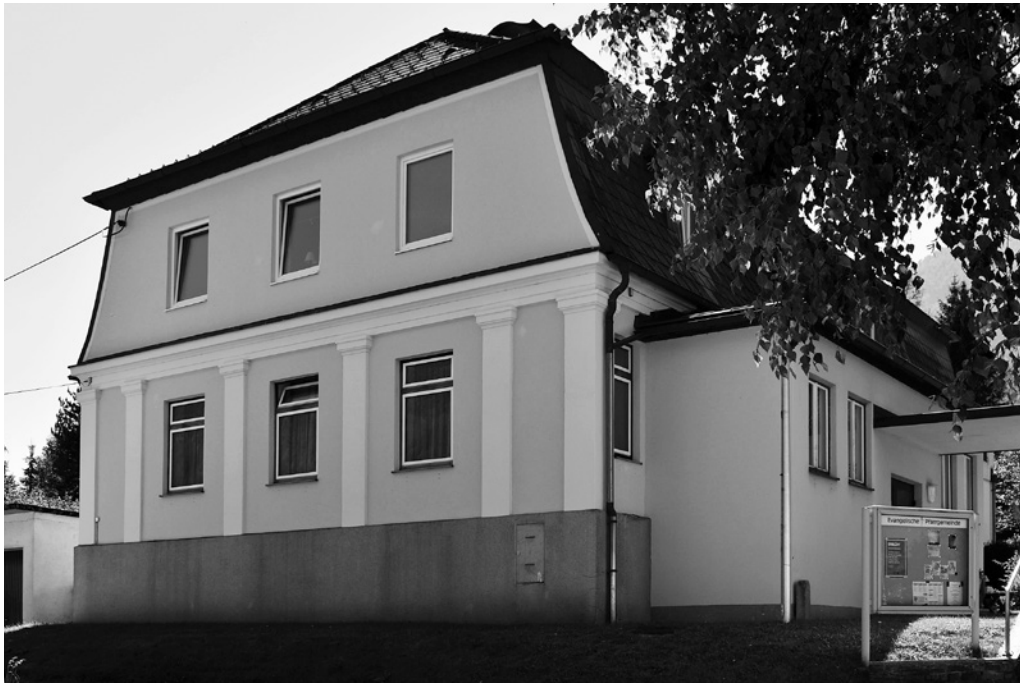
5 Otto Bartning, evangeličansko župnišče, 1910. Rottenmann

smo dosednji pisci, izhajajoč iz napačnega podatka, da je bila cerkev zgrajena leta 1908, pa tudi zaradi pomanjkanja pisnih virov, napačno sklepali, da sta oba objekta nastala sočasno in posledično Bartningu zmotno pripisovali tudi avtorstvo cerkve, dodatno pa je k temu prepričanju botrovalo dejstvo, da sta bili obe stavbi s hodnikom povezani v celoto. 21 Atribucija ne drži, pri čemer je ne zavračajo le podatki iz sočasnega časopisja, temveč tudi dejstvo, da je v času gradnje radeljske cerkve arhitekt še študiral, na Štajerskem pa je pričel delovati šele leta 1906, torej leto dni po njeni dograditvi. 22