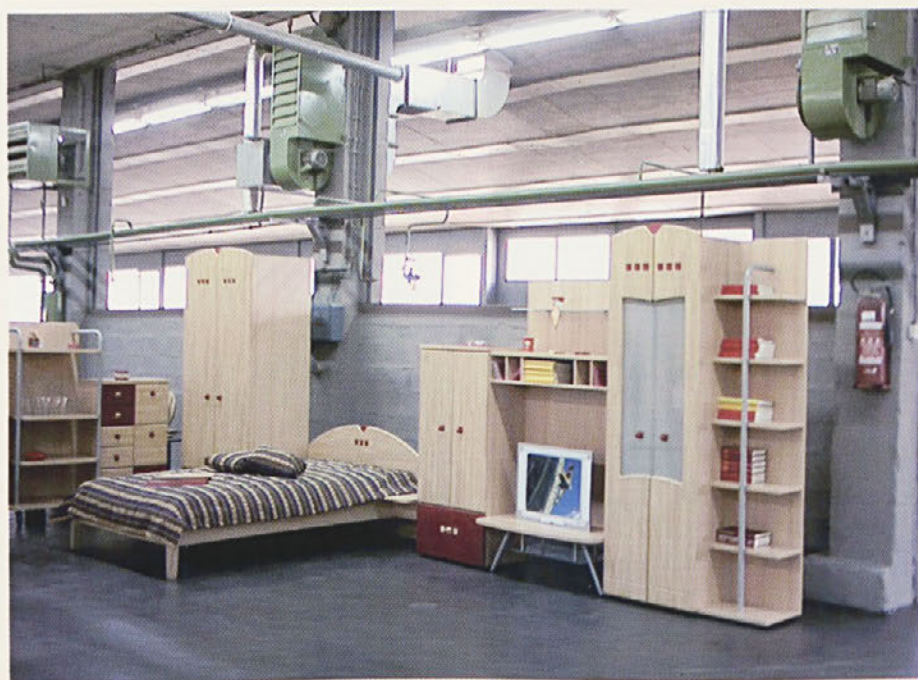
Otroška soba Clipper