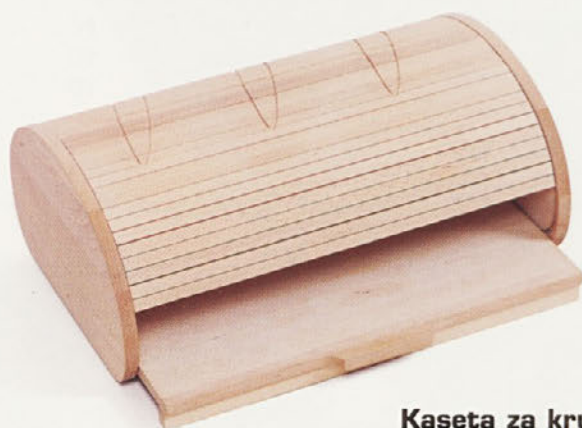
Kaseta za kruh*

Na sejmu je Novoles samostojno razstavljal izdelke blagovne znamke SERVUS. Pred začetkom sejma je med razstavljalci prevladovalo zelo negativno in neoptimistično vzdušje, saj je bila večina razstavljalcev pod vplivom slabih prodajnih rezultatov v letu 2002 in slabih napovedi za leto 2003.