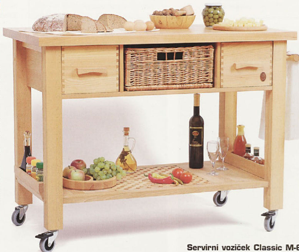
Servirni voziček Classic M-60*

Glede na sejmski utrip in že dana naročila lahko računamo na rast prodaje programa SERVUS predvsem v skandinavskih državah.