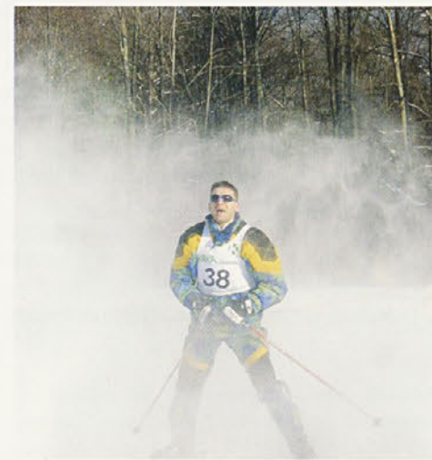
Zaviranje z ročno