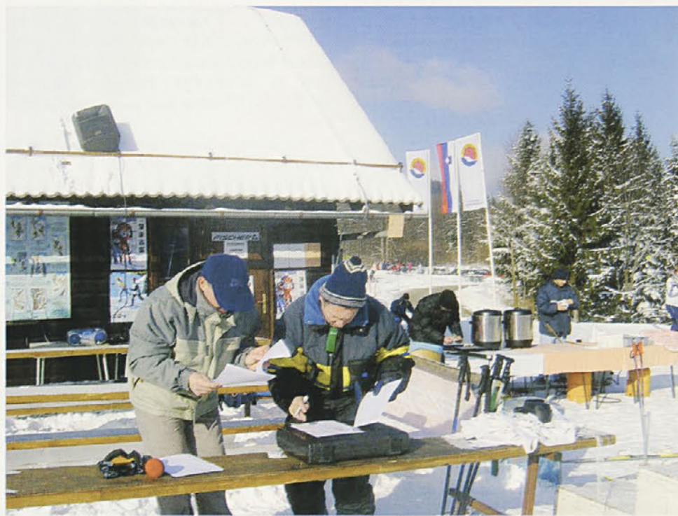
Začelo se je