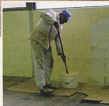
Pripravljalna dela v Soteski

novim - načinom trženja bomo našim najpomembnejšim kupcem lahko predstavili vse novosti in na samem sejmu slišali še njihove pripombe na že razvite programe ali pa programe v razvoju.