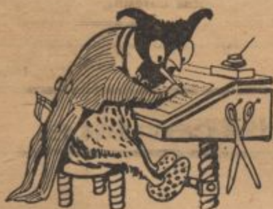
Gorica, 1. januarja 1923.

Prav neprijetno mi je, da moram na novega leta dan pisati to kroniko. Ne radi tega, ker je praznik. Saj ne pijem drugega kot tu pa tam porcijo ricinovega olja, da lažje prebavim razmere. Tudi ne zato, ker mi je na novega leta dan že na vse zgodaj voščila neka ženska vse najboljše, saj sem itak vedel, da bo letos smola na vseh koncih in krajih.