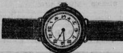
Birmanske zapestne ure, srebrne od Din 152— naprej. 14 karat zlato od Din 296— naprej.

PREŠERNOVA ULICA 4 — POLEG FRANCISKANSKE CERKVE — NAJVEČJA ZALOGA UR, ZLATNINE IN SREBRNINE. — LASTNA TOVARNA UR V SVICI