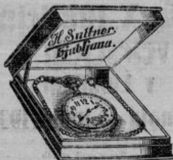
Birmanske ure za dečke od Din 44— naprej.