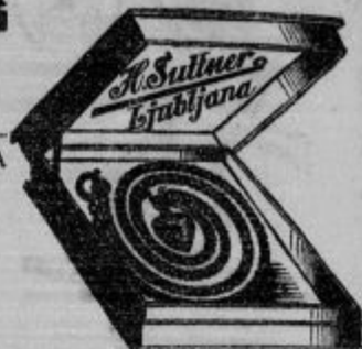
Srebrne vratne verižice (Collier) od Din 20— naprej Zlate vratne verižice (Collier) od Din 85— naprej