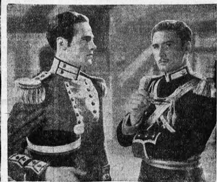
Geoffrey in Perry sta molčala

Kaj naj vse to pomeni? Njegov brat in Elizabeta? ...