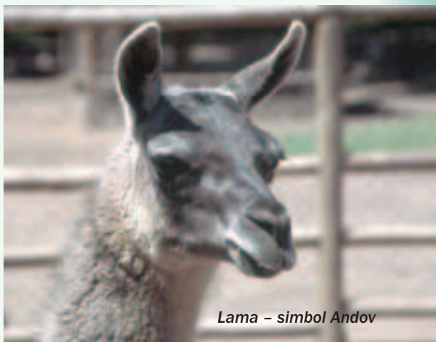
Lama – simbol Andov

Prvi višinski tabor na Normalni smeri je Nido de Condores (5400 m), do katerega je od 4 do 7 ur hoje, odvisno od pripravljenosti. Na