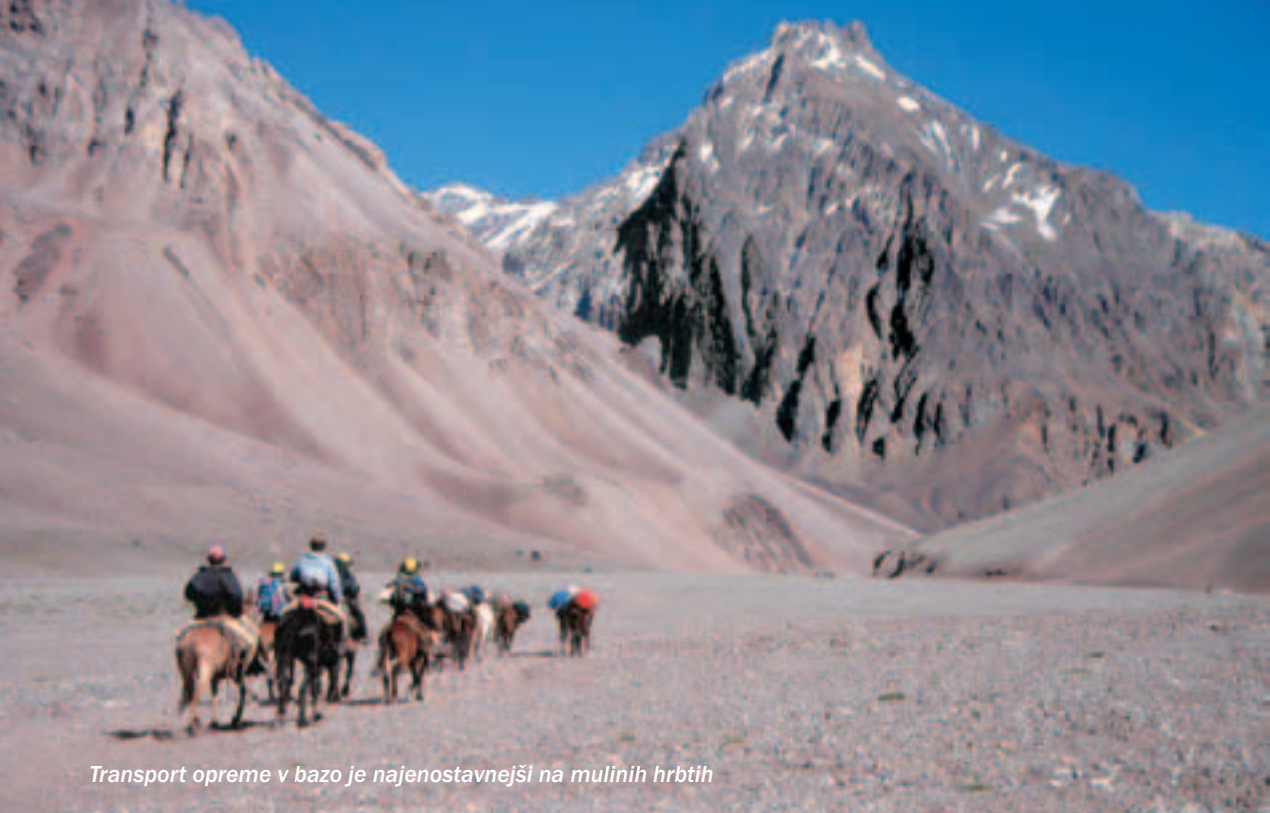
Transport opreme v bazo je najenostavnejši na mulinih hrbtih

nekateri so bili tam že večkrat in po večini brez uspeha -, da se je treba povzpeti na vrh hitro in s čim manj višinskih taborov. Tako smo po počitku v bazi krenili navzgor lahki in zato tudi hitri. A hiter tam ne pomeni vselej, da moraš dirjati navzgor. Pravzaprav velja, da hodi počasneje in po daljši poti, pa boš hitrejši. Vsak, ki se je zaganjal naravnost navzgor, je vselej ostal daleč za nami. Po treh urah vzpona sem se že sončil na Nidu de Condores. Poležavanje, kuhanje pa hrana in pijača ... Že pred mrakom smo bili v spalnih vrečah. Tu in tam je šotor stresel veter, vendar je bil zelo odporen. Imeli smo namreč dvojne palice, ki smo jih zlepili s trakom, in to je zelo povečalo njihovo trdnost. Včasih tam veter trga ali odnaša šotore, celo s plezalci vred.