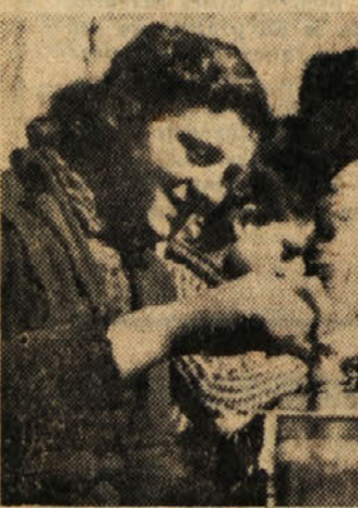
Pionirji z Bučke so našli prijetno razvedrilo tudi ob šahu

izdelke bo poslal na okrajno razstavo, ostale pa bo razstavil 19. maja na Bučki.