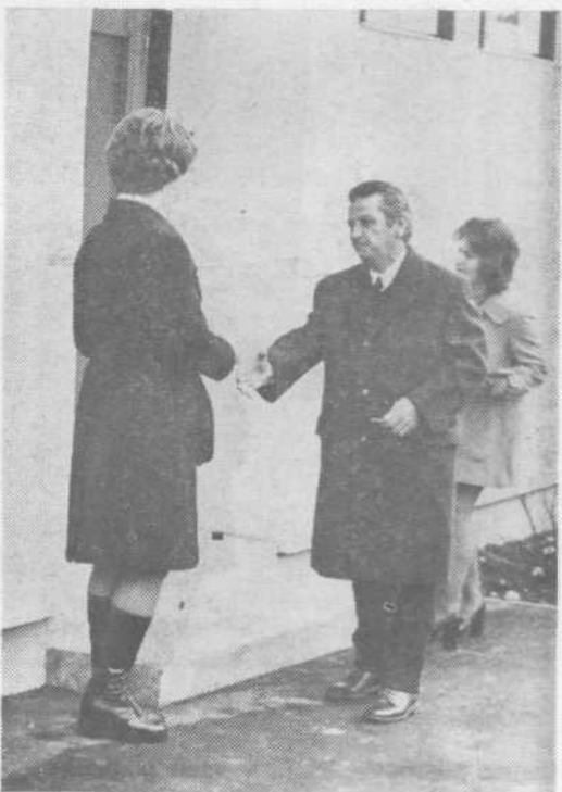
Vrtec na Brodu je vendarle odprt. Napolnil ga je vriše 250 otrok