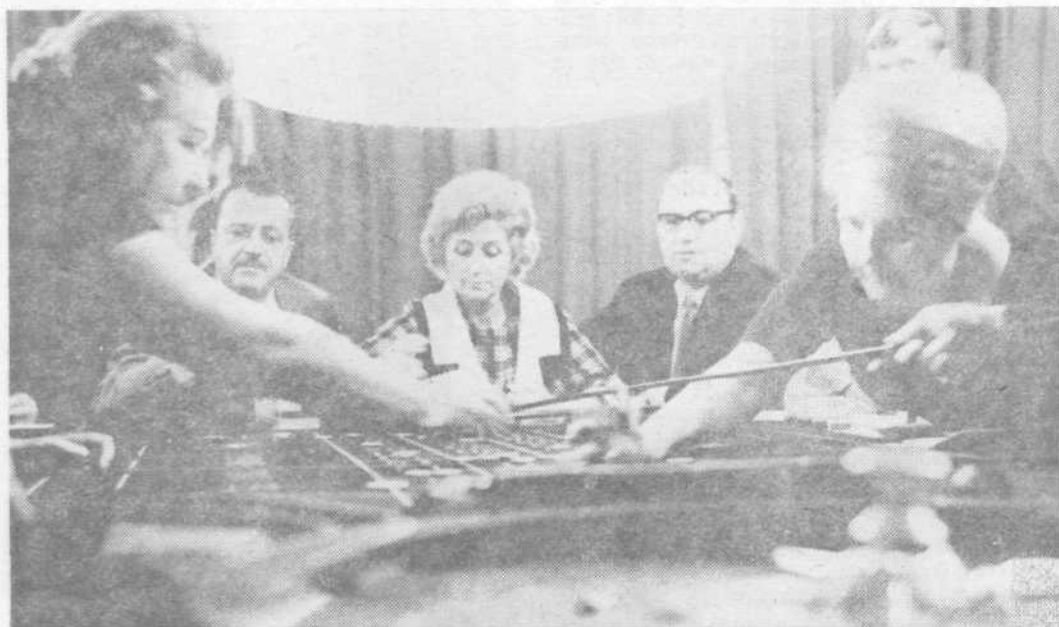
Tudi na tak način se da porabiti denar ...

J. Zlatnar: »Imeli smo že nekaj posvetovanj, kjer smo izmenjali mnenja in izkušnje. Ugotovili smo, da se pravzaprav povsod ukvarjajo s podobnimi problemi. Med njimi bi omenil zemljiške knjige, v katerih niso vpisane etažne lastnine, kar zelo otežkoča preverjanje. Če ima nekdo (Nadaljevanje na 6. strani)