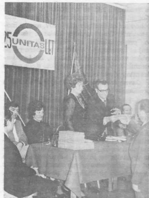
Ob 25-letnici kovinskega podjetja »Unitas« so podelili plakete dolgoletnim sodelavcem