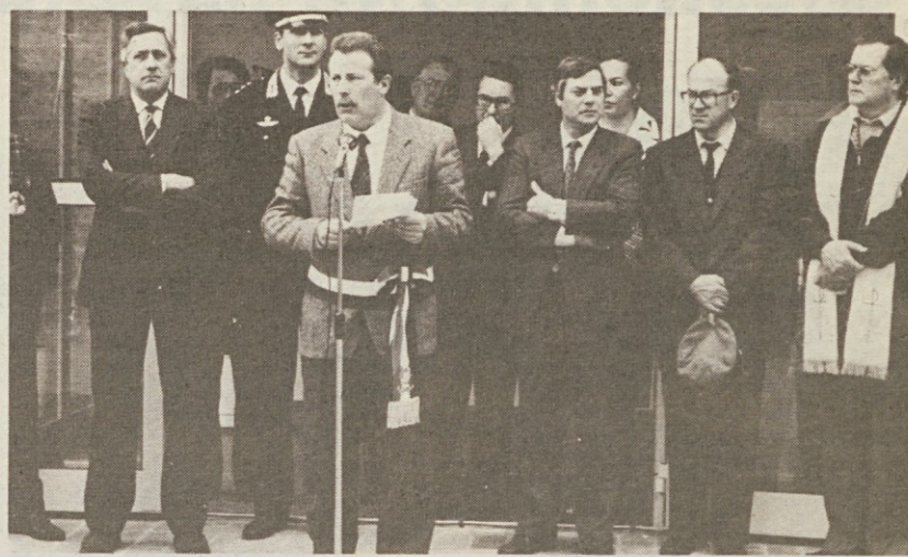
Predstavniki oblasti na otvoritvi novega vrta

AŽLA — Prejšnji teden so v Ažli (v špetski občini) imeli velik praznik, ko so uradno odprli nov vrtec. Bil je to pravi praznik, na katerem se je zbralo veliko ljudi iz Ažle in drugih vasi, predstavnikov oblasti in seveda staršev in ožjega sorodstva skoraj štirideset malčkov, ki že od lanske jeseni obiskujejo nov vrtec.