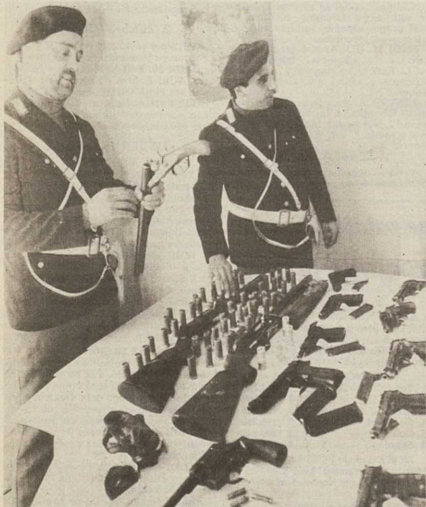
Del orožja, ki so ga zaplenili neapeljskim kamoristom