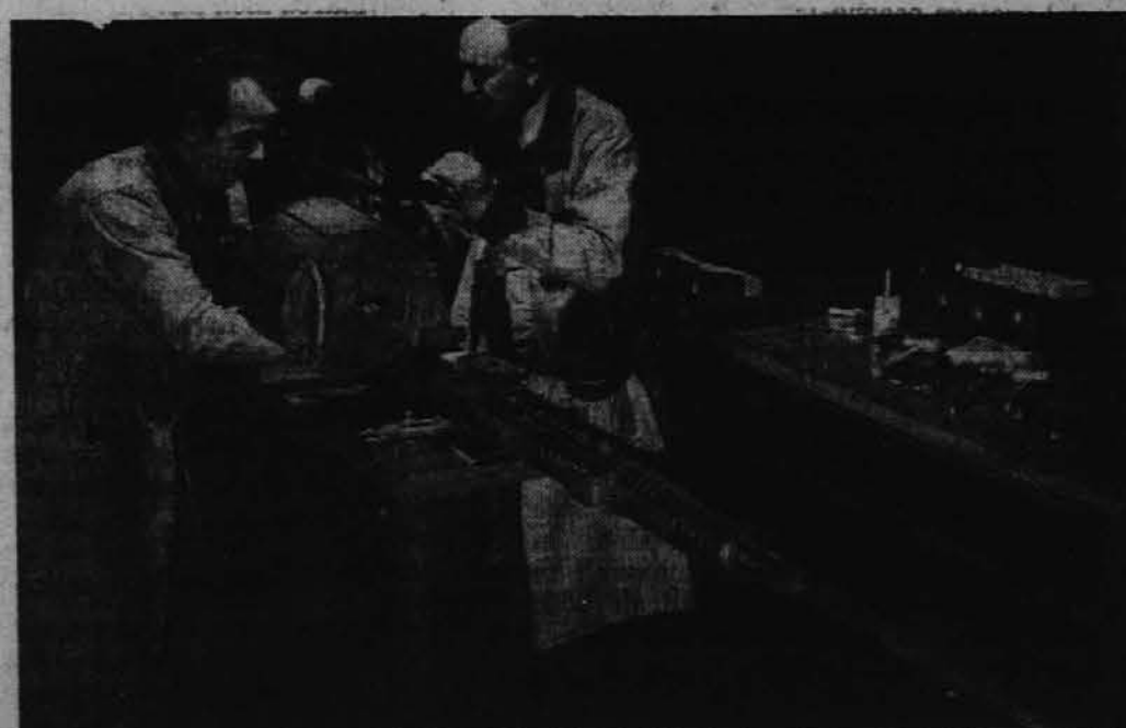
V Pontiac avtomobilski tovarni v Detroitu izdelujejo protizračne topove najnovejše vrste, ki streljajo nenavadno hitro ter s o zlasti namenjeni za bombnike