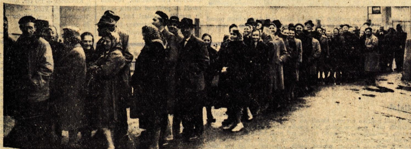
Ceprav 1. april velja za neresni dan, so v sredo na Kurivu v Kranju popisovali naročnike premoga. Direktor podjetja nam je dejal, da bodo že do 10. maja prejeli tolikšno količino premoga, da bodo lahko zadostili potrebam 800 do 900 kupcev, ki so ta dan stali v vrsti že od zgodnjih jutranjih ur. Iz Velenja bodo namreč do tedaj dobili 3 tisoč ton premoga. Naslednje interesne bodo vplivali prihodnji mesec

stavno ne najdejo potrebnih »notranjih rezerv«. S to ugotovitvijo se plenum nikakor ni strinjal, saj je znano, da so proizvodna sredstva v okraju izkoriščena le 54 odstotno. Mnenja so bili, da je treba notranje rezerve iskati na račun neizkoriščenih strojev in ne z dodatnim obremenjevanjem delavcev. Nedvomno bo treba tudi izpopolniti način nagrajevanja, saj je to mnogokrat ovira za večjo produktivnost. M.Z.