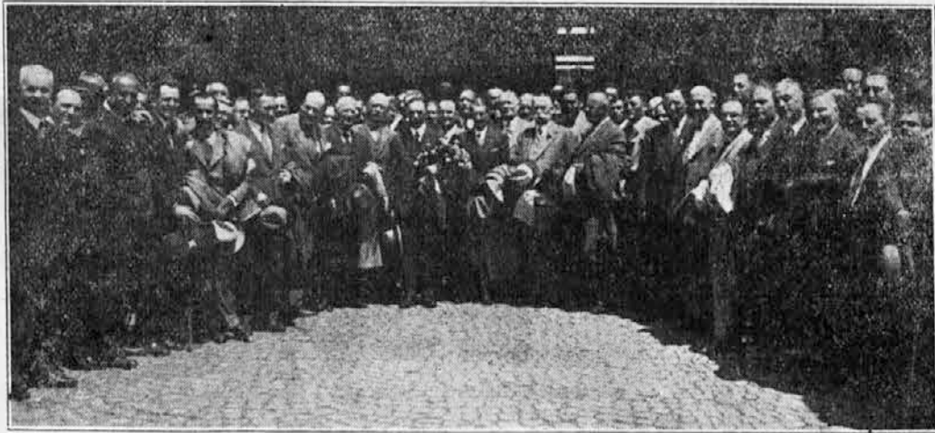
Udeleženci delegacije jugoslovnskih gospodarstvenikov pred postajo v Sofiji

Točno po programu je privozil naš vlak na postajo, kjer nas je sprejela velika množica občinstva in gromki »hura«-klici so zadoneli po prostranem peronu sofijskega kolodvora. Godba obrtno-nadaljevalne šole je intonirala jugoslovnsko himno, katero je zbrana množica poslušala stoje in odkritih glav. Niso še utihnili zadnji akordi, že se je dvignil ponovni val navdušenja in zadonela je veličastna