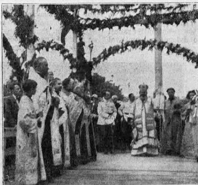
Car Boris in carica Ivana z metropolitom Štefanom med službo božjo

bratskega naroda. Že ob devetih dopoldne se je pričela pomikati vsa ta množica občinstva na velikanski trg pred cerkev Sv. Aleksandra Nevškega, vnes pa oddelki vojske ter raznih šol, vsaka s svojo godbo na čelu. Vsa Sofija je žarela v ognju navdušenja in praznik mladine se je pretvoril v praznik naroda.