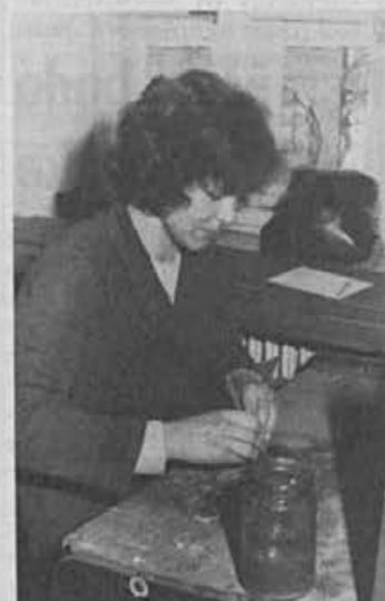
V Rovtahn pravijo: med naj- bolj nerealnimi normami je prav gotovo norma na se- stavljanju povz