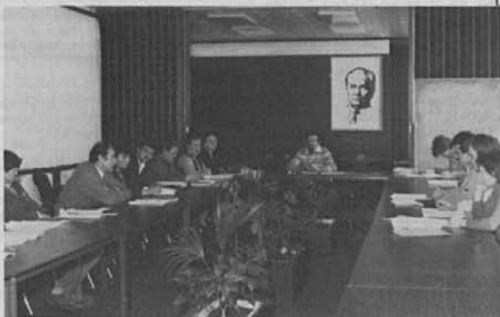
Na seji delavskega sveta delovne organizacije