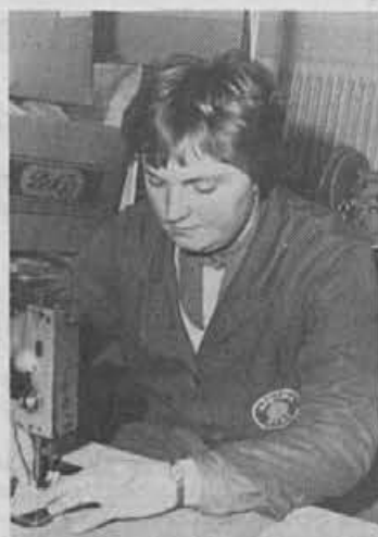
Tudi šivanje cik-cak je ča- sovno bolj zahtevno