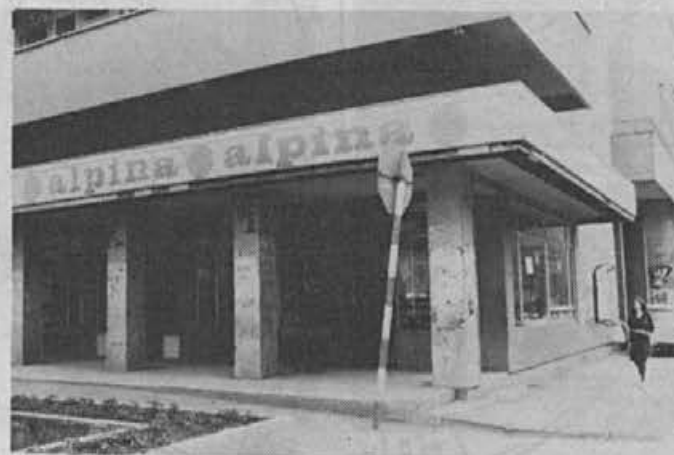
Zunanost prodajalne u Čačku

Ispunjavamo pa i prebacujemo i mesečne planove u ovoj godini, pa već sada sa sigurnošću očekivamo da će i ovogodišnji plan prometa od 36 miliona dinara biti sigurno ispunjen a nas petoro zaposlenih se nada da ćemo ostvariti i više plana.