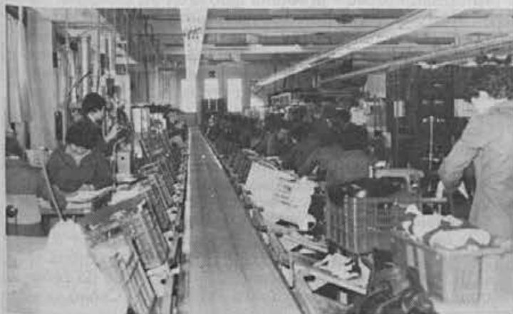
Iz obrata na Colu