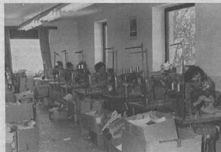
Delovne razmere v Rovtahn se izboljšujejo, vendar je po- manjkljivosti še veliko