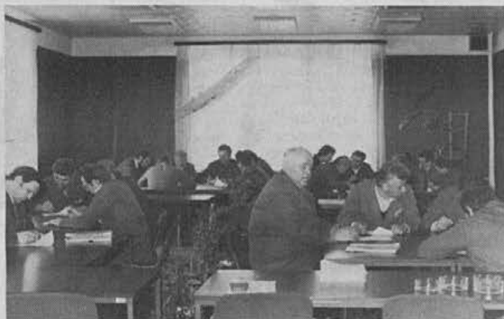
Ob koncu seminarja o delu z ljudmi so vodilni in vodstveni delavci opravili tudi test znanja