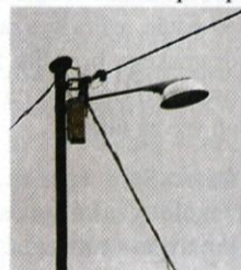
Zelo ustrezna razsvetljava.

Slovenski astronomi in naravovarstveniki z raznimi akcijami predstavljamo ta problem javnosti, pa smo do sedaj dosegli bolj malo. In kaj je največji problem? Umetna svetloba zmoti naravni bioritem življenja nočnih živali, kar se kaže ob večjem upadu nekaterih nočnih žuželk. To pa seveda ni dobro za naravno ravnovesje, astronomom pa preosvetljenost neba onemogoča normalno delo! Naj kot zanimivost dodam, da je svetloba našo najbližjo galaksijo zapustila takrat, ko so se po našem planetu plazili dinosavri in da se na koncu izgubi v umetni svetlobi. Res škoda! Tudi v naši občini je neustreznih svetilk mnogo preveč, ustreznih je samo četr! To lahko preverite: pogledajte slike! Pod črko A sta dva primera neustrezne svetilke, takšne prevladujejo v naši občini, pod črko B pa sta dva primera zelo ustreznih, varčnih ekoloških svetilk! Katerih boste več našeli? Vendar pa niso neustrezne samo javne luči. V naši občini pa sploh povsod po Sloveniji imamo veliko