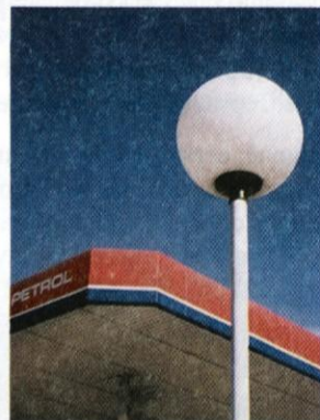
Neustrezna luč na Petrolu.

Slovenski astronomi in naravovarstveniki z raznimi akcijami predstavljamo ta problem javnosti, pa smo do sedaj dosegli bolj malo. In kaj je največji problem? Umetna svetloba zmoti naravni bioritem življenja nočnih živali, kar se kaže ob večjem upadu nekaterih nočnih žuželk. To pa seveda ni dobro za naravno ravnovesje, astronomom pa preosvetljenost neba onemogoča normalno delo! Naj kot zanimivost dodam, da je svetloba našo najbližjo galaksijo zapustila takrat, ko so se po našem planetu plazili dinosavri in da se na koncu izgubi v umetni svetlobi. Res škoda! Tudi v naši občini je neustreznih svetilk mnogo preveč, ustreznih je samo četr! To lahko preverite: pogledajte slike! Pod črko A sta dva primera neustrezne svetilke, takšne prevladujejo v naši občini, pod črko B pa sta dva primera zelo ustreznih, varčnih ekoloških svetilk! Katerih boste več našeli? Vendar pa niso neustrezne samo javne luči. V naši občini pa sploh povsod po Sloveniji imamo veliko