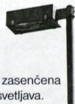
Popolnoma zasenčena in varna razsvetljava.

prečudovitih cerkva! Že prav, da so osvetljene, samo če bi bile ustrezno, to pa na žalost ni nobena. Končna misel. Komu služijo osvetljeni spomeniki, cerkve, ulice...itd. ob dveh zjutraj? Komarjem? Pač še eno nepremišljeno človeško dejanje. Če ne verjamete v moje besede, se zvečer samo ozrite proti Ljubljanski kotlini! Vse žari, koliko kilovatnih ur električne energije gre v nebo? To pa samo zaradi neustrezne razsvetljave. Naj dodam podatek iz leta 1997, v Ljubljani za javno razsvetljava porabljenih 160 milijonov SIT (1,7 milijona DEM). Kaj ne bi bilo bolje, da bi prihranjen denar ter odvečno električno energijo (ta je namenjena javni razsvetljavi) uporabili za ogrevanje stanovanj...itd? To je moj predlog! Lepo prosim, da poda svoje mnenje na to temo še županja ali kdo od pristojnih.