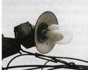
Neustrezna hlevska luč.

Onesnaženje! Beseda, ki spremlja naš vsakdan že vrsto let! Pod onesnaženje lahko prištejemo tudi JAVNO RAZSVETLJAVO! Zakaj? Razlaga sledi. Javna razsvetljava je v varnostne namene zelo koristna, vendar ima kot vsaka medalja tudi ta dve plati. Neustrezna javna razsvetljava-nezasenčena prši svetlobo vse naokoli, le v tla jo usmeri bolj malo ali pa sploh nič. Kaj nam pomagajo javne luči, če pa le te osvetljujejo nebo! Mar niso namenjene osvetljevanju cest?