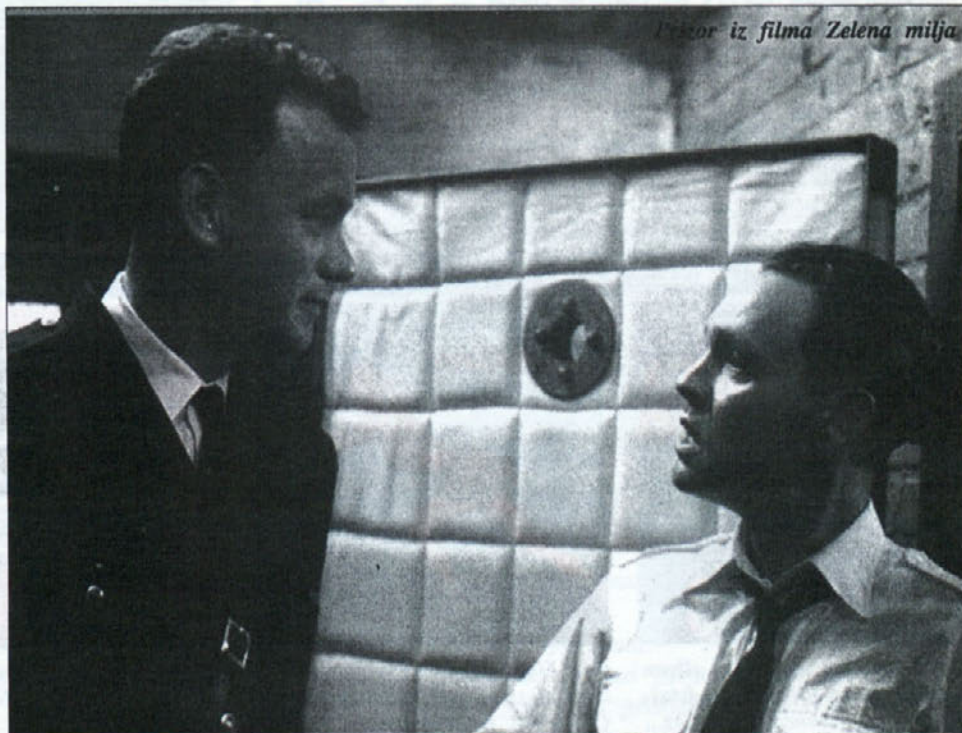
Prizor iz filma Zelena milja

Savinov likovni salon Odprto: v času razstav vsak dan, razen nedelje in praznikov od 10. - 12.00 in 16. - 18.00, za skupine po dogovoru