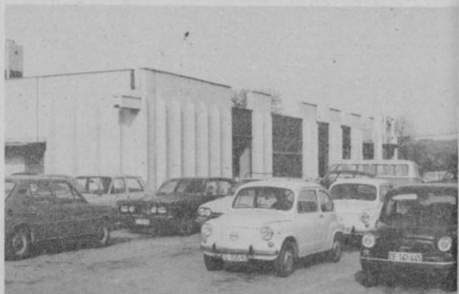
Blagovnica Savinjskega magazina v Sempetru je zanimiva za kupce tudi zaradi velikih parkirišč in diskontne prodaje. Podobno velja tudi za njeno novejšo sestro na Polzeli.