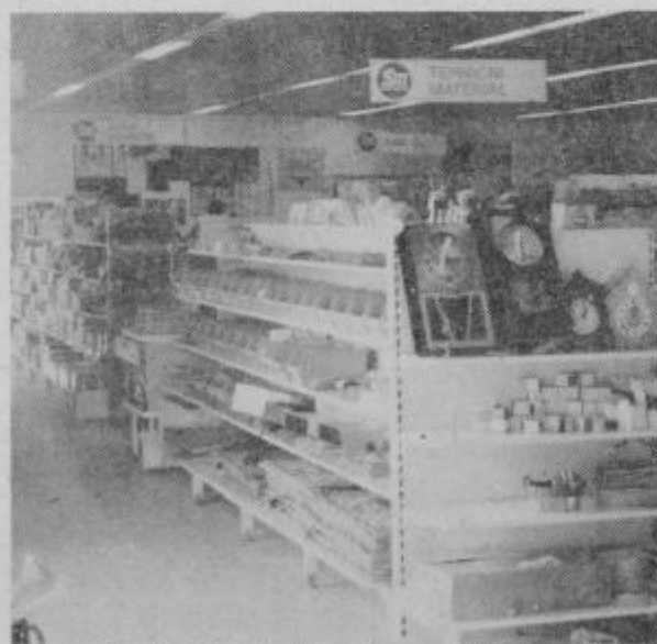
Trgovci se trudijo, da bi bili kar se da dobro založeni tudi s tehničnim materialom.