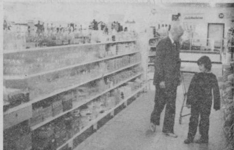
Izdelki so razstavljeni tako, da kupcem takoj padejo v oči in je tudi izbira lažja.