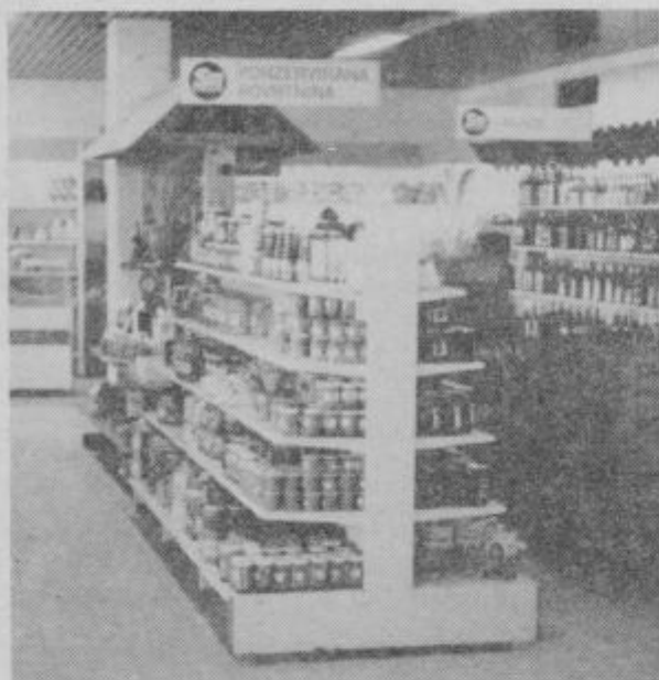
V trgovinah Savinjskega magazina dobijo kupci tako rekoč vse, kar rabijo za vsakdanje življenje.

Savinjski magazin je po družbenih programih organizacija, ki je zadržena za nosilca preskrbovanja tako v rednih kot tudi izrednih razmerah.