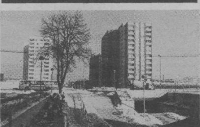
Zimski pogled na stolpnice ob Litijski cesti