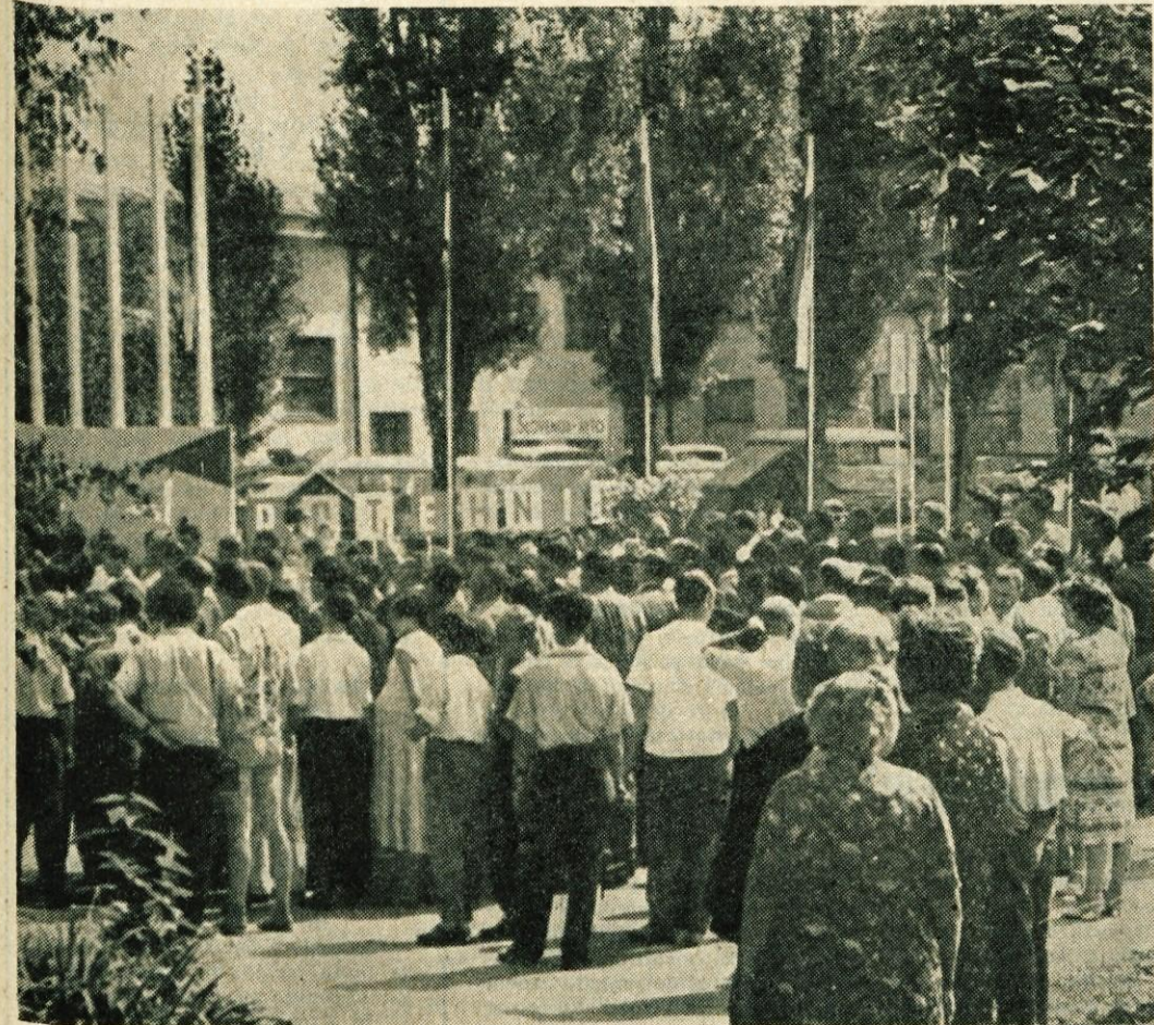
Ze ob otvoritvi je bilo letos za 8. gorenjski sejem veliko zanimanje