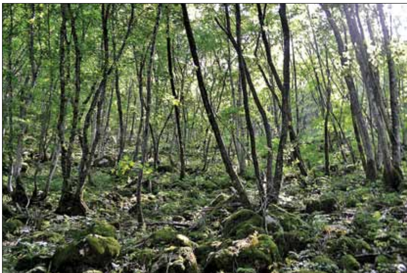
Slika 8: Sestoj subasociacije Corydalido ochroleucae-Aceretum pseudoplatani veratretosum nigri , udornica Risnik pri Divači.

imamo podatke o lesni zalogi in drevesni sestavi zbrane le na ravni RGR, smo te podatke za posamezne gozdne rastiščne tipe pridobili s presekom med digitalizirano karto gozdnih združb in opisi