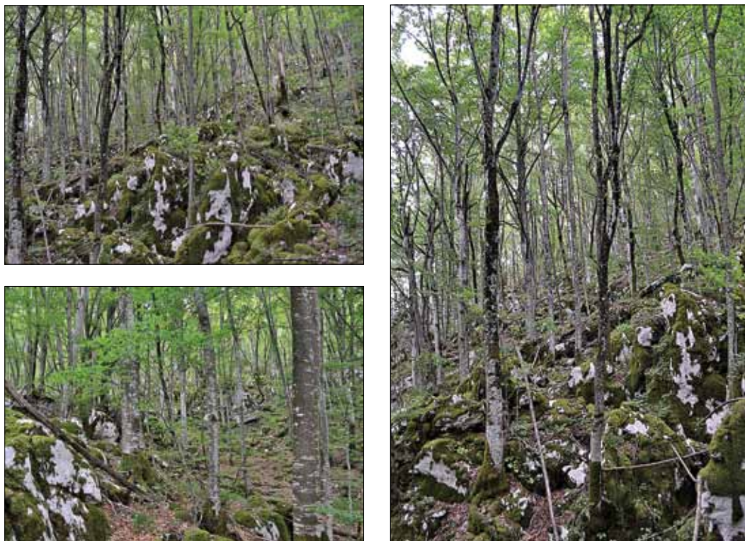
Slika 4: Sestoji subasociacije Lamio orvalae-Fagetum pseudofumarietosum albae , Čičarija, pod Kovnico.