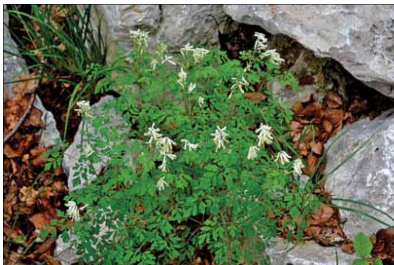
Figure 9: Pseudofumaria alba = Corydalis ochroleuca .

Preglednica 6: Sestava lesne zaloge po skupinah drevesnih vrst in gozdnih rastiščnih tipih znotraj RGR Toplo-ljubna bukovja na karbonatih