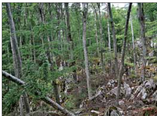
Slika 5: Sestoji subasociacije Lamio orvalae-Fagetum pseudofumarietosum albae , Čičarija, Plasice. Figure 5: Stands of the subassociation Lamio orvalae-Fagetum pseudofumarietosum albae , Čičarija, Plasice.

blizu večini naših popisov. Veliko lokacij M. Accetta (ibid.) je prav tako pod Kovnico, poleg tega navaja še toponime Župnica, Grde jame, Glavičina in Žlibe, ki so prav tako v omenjenem območju, le nekoliko bolj severno. Na podlagi izračunane floristične podobnosti po Sørensen (1948) bi vse tri primerjane sintaksone lahko uvrstili v isto asociacijo. Tega v primeru bukovih gozdov v Čičariji ne moremo storiti. Vzrok je v sestavi nosilnih drevesnih vrst (edifikatorjev), ki v našem primeru nista gorski javor in (ali) lipa, temveč bukev – torej gre za bukovo združbo, ki pa je po značilnostih rastišča in po vrstni sestavi zelo podobna že opisani javorovo-lipovi združbi. Proučeni gozdovi v Čičariji so bili v preteklosti zelo sekani, čeprav zaradi odročnosti in težkega terena razmeroma pozno, najbrž šele v začetku 19. stoletja. O vidnih sledovih oglarjenja je poročal Accetto (1991). Zdajšnje stanje, ki je torej posledica minulega gospodarjenja, potrjuje, da bukev lahko uspeva tudi na zelo skrajnih rastiščih, kjer je