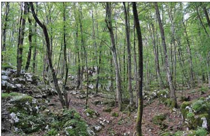
Slika 3: Sestoji subasociacije Lamio orvalae-Fagetum pseudofumarietosum albae , Čičarija, Plešivski gozd. Figure 3: Stands of the subassociation Lamio orvalae-Fagetum pseudofumarietosum albae , Čičarija, Plešivski gozd.