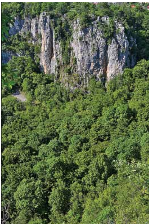
Slika 7: Udornica Risnik pri Divači. Figure 7: Collapse doline Risnik near Divača.

imamo podatke o lesni zalogi in drevesni sestavi zbrane le na ravni RGR, smo te podatke za posamezne gozdne rastiščne tipe pridobili s presekom med digitalizirano karto gozdnih združb in opisi