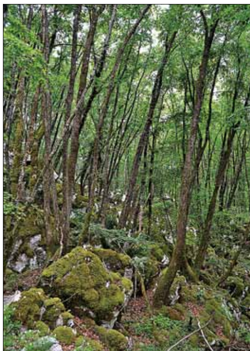
Slika 6: Sestoj asociacije Corydalido ochroleucae-Aceretum pseudoplatani , Čičarija, Plasice. Figure 6: Stand of the association Corydalido ochroleucae-Aceretum pseudoplatani , Čičarija, Plasice.

Bukove gozdove na karbonatni podlagi v jugozahodnem delu gozdnogospodarske enote (dalje GGE) Brkini II uvrščamo v rastiščnogojitveni razred