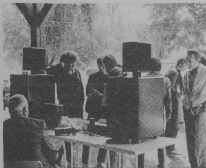
CB klub ADRIATIC in DLT Papirnice Vevče sta v septembru organizirala na letnem kopališču Vevče že drugi »Hi-fi« sejem; po mnenju obiskovalcev je bil uspešnejši kot prvi.