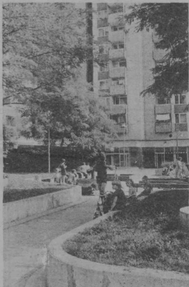
Uh, še je vroče...