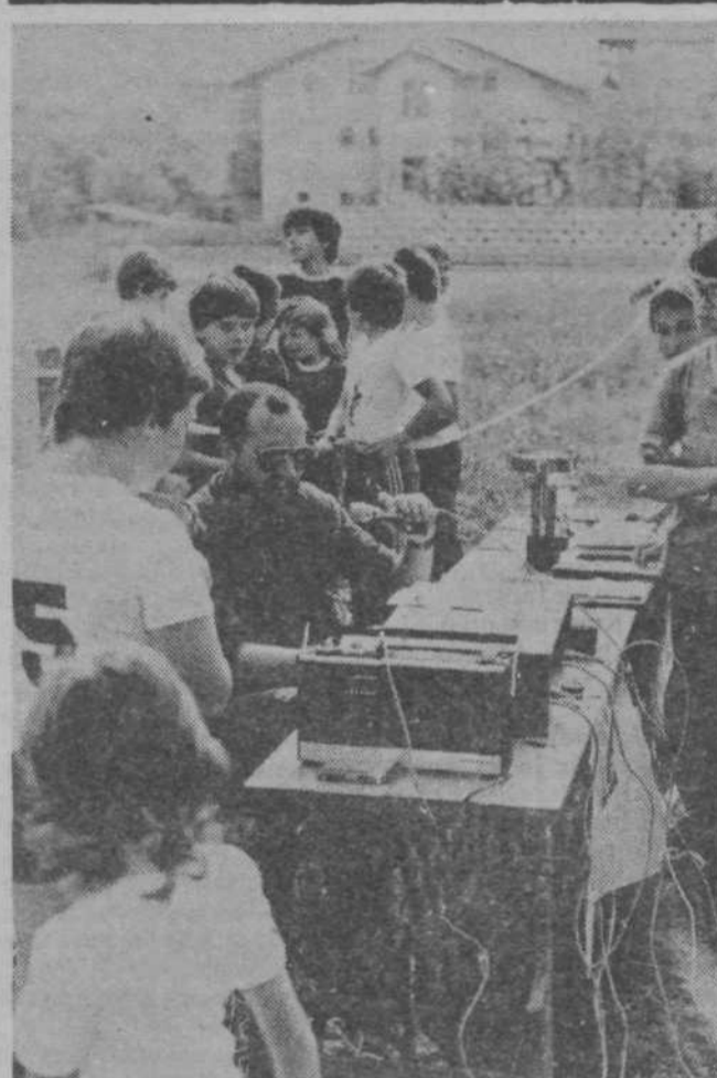
Starejši in mlajši so tudi pri kulturnem delovanju v naši KS kot eden — leta celo niso prav nič pomembna — in zato so tudi uspehi zagotovljeni.