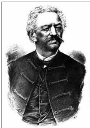
Franz Ferdinand Wiesner oz. Ferdo Livadić »Samoborski«