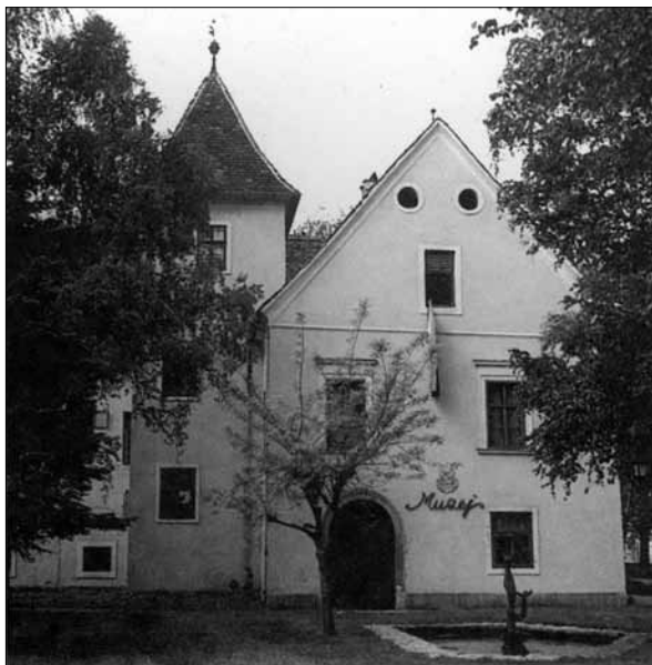
Livadićev dvorec/kurija v Samoboru je danes sedež Samoborskega muzeja.

Do sedaj odkrita Wiesnerjeva glasbena zapuščina obsega 140 hrvaških samospevov »popijevaka«, 10 slovenskih, 45 nemških, 32 cerkvenih pesmi, 40 koračnic za klavir itn. Najbolj pa je znan po budnici Još Horvatska nej' propala , s katero se je za vedno usidral v narodno zavest Hrvatov. Izročilo pravi, 6 da se je Ljudevit Gaj sredi zime 1833 s sanmi peljal na obisk k Ferdu v Samobor. Idila jasne zimske noči in odmev petja vaščanov sta ga tako prevzela, da je takoj po prihodu v dvorec zapisal verze, ki jih je sestavil že na poti. Ferdo je sedel za klavir in začel skladati melodijo na Gajevo besedilo.