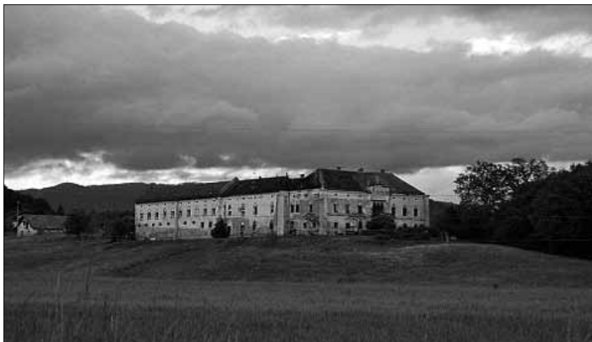
Današnje, razpadajoče stanje dvorca Prešnik v Šmartnem pri Celju. Uredba o državnem prostorskem načrtu za območje Šmartinskega jezera načrtuje delno obnovo gradu Prešnik in njemu pripadajočega parka. (Uradni list RS, št. 33/07, 70/08 – ZVO-1B in 108/09).